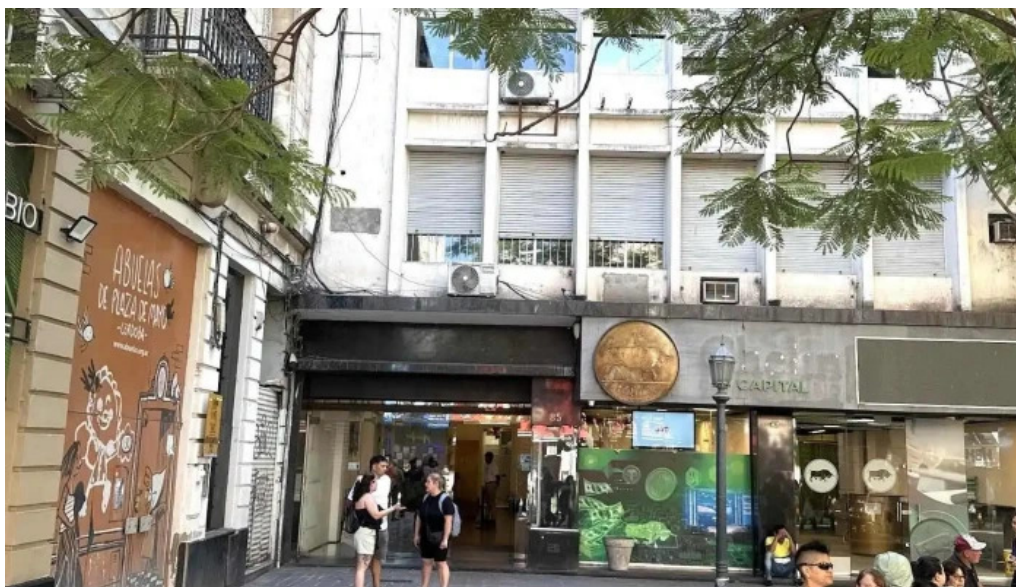
Firenze coop del propietario