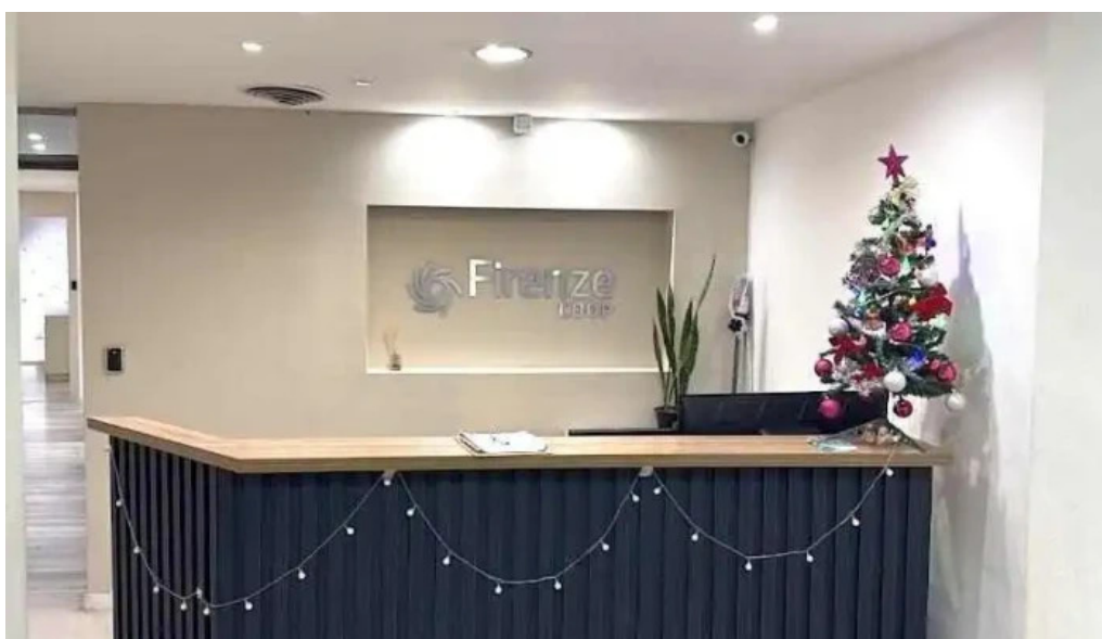
Firenze coop cordoba