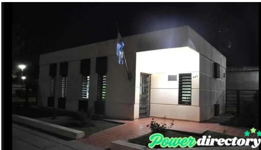
Cooperativa de electricidad y servicios publicos charras Ltda charras