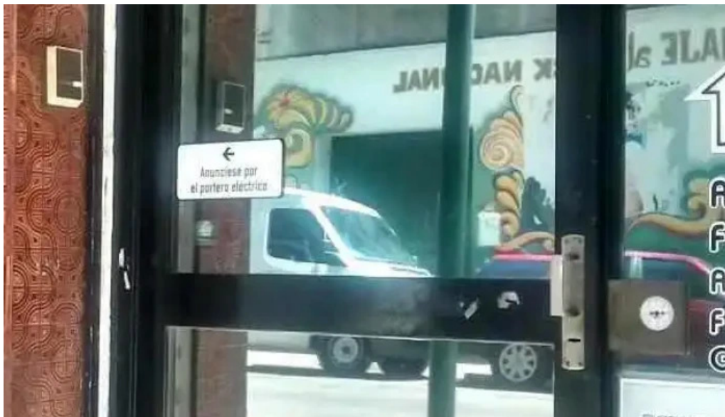
Ferrocoop cdad autonoma de buenos aires