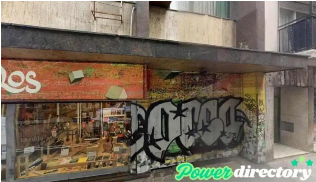
Covipol pfa cooperativa de vivda credito y consumo ltda p el personal de p f a cdad autonoma de buenos aires