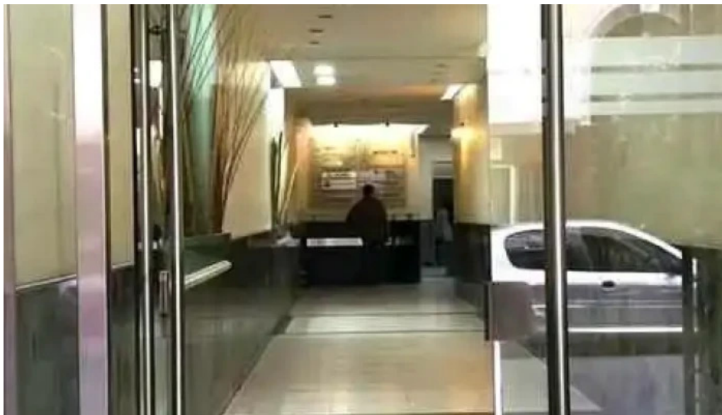
Covipol pfa cooperativa de vida crédito y consumo Ltda p el personal de p f a del propietario