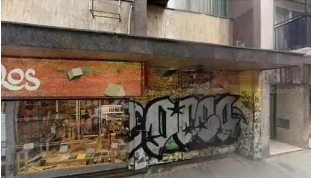
Covipol pfa cooperativa de vivda credito y consumo ltda p el personal de p f a como llegar