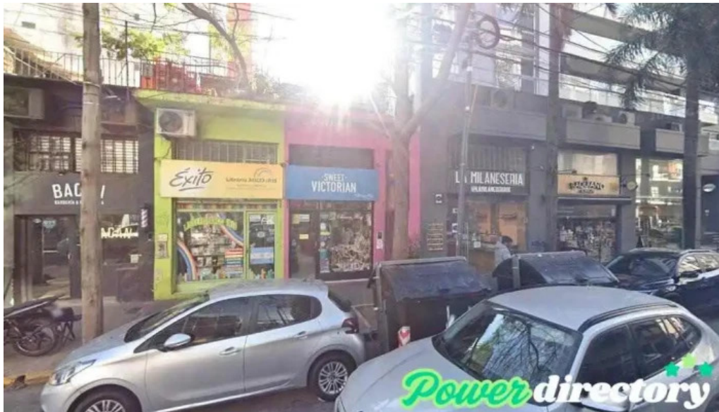
Cooperativa de credito renacer Ltda cdad autonoma de buenos aires