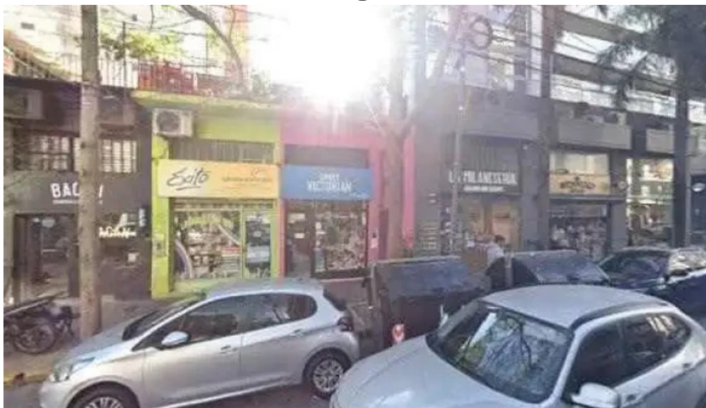
Cooperativa de credito renacer Itda puntaje