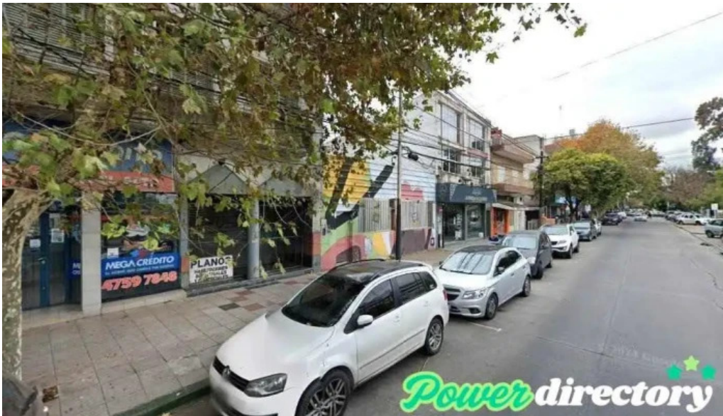
Mega credito buenos aires