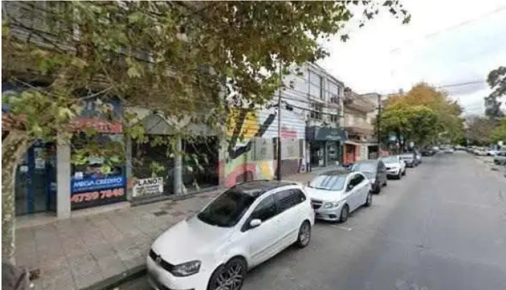
Mega credito comentarios