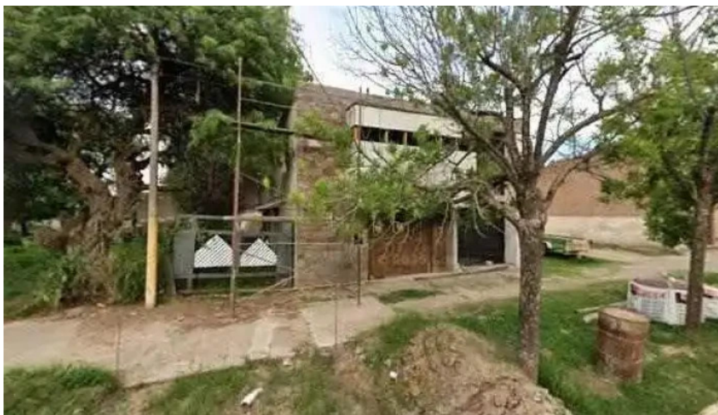
Mutual club libertad villa trinidad filial arrufo catalogo