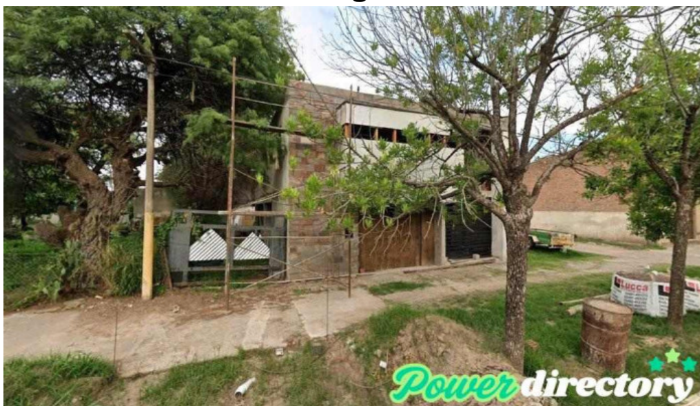
Mutual club libertad villa trinidad filial arrufo arrufo