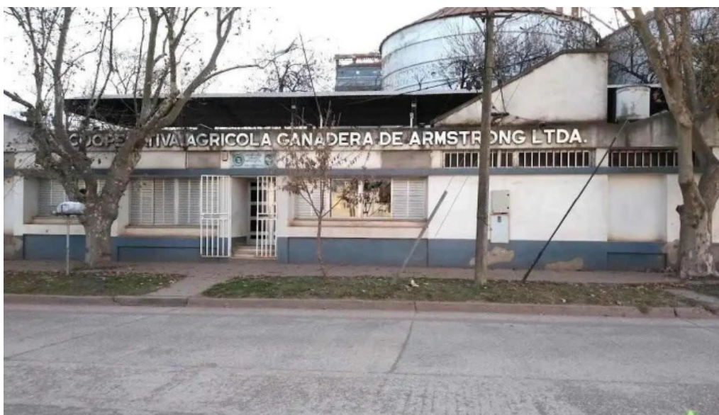
Cooperativa agricola ganadera de armstrong del propietario