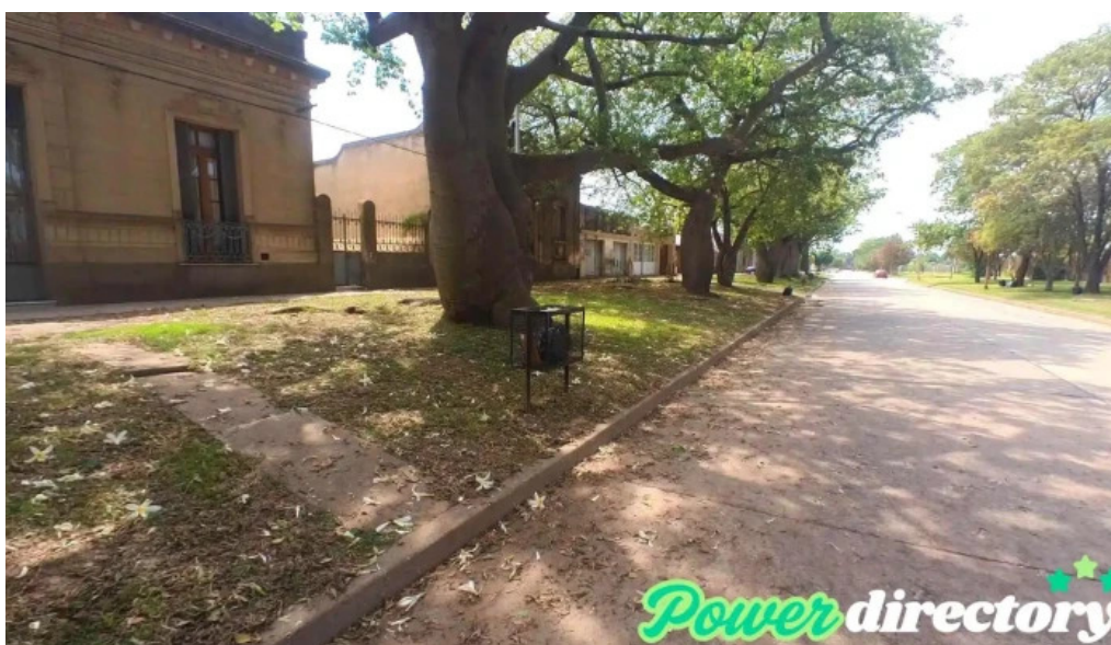
Cooperativa agricola ganadera de armstrong armstrong