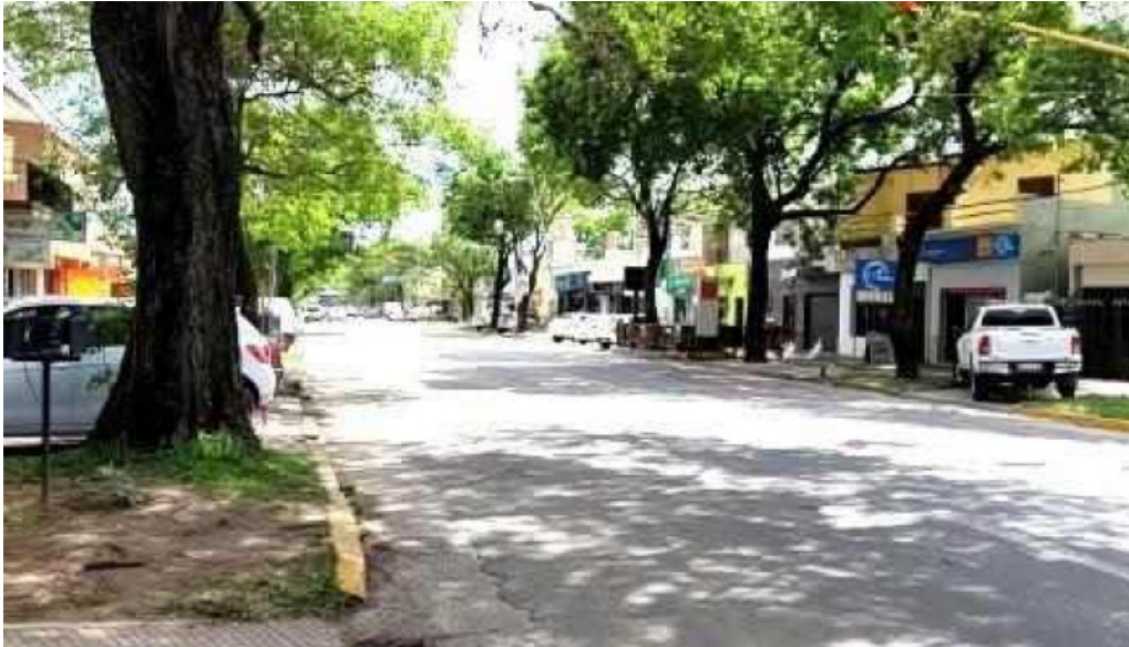
Silvercred santo tome prestamos personales videos