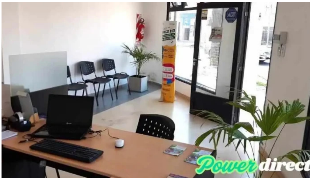
Silvercred santo tome prestamos personales interior