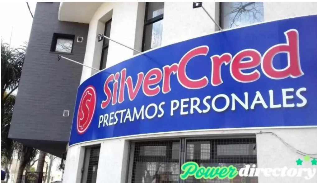
Silvercred santo tome prestamos personales santo tome