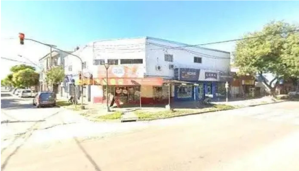
Silvercred santo tome prestamos personales zonadeg