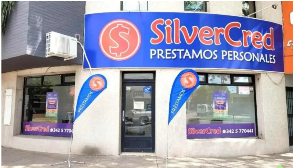
Silvercred santo tome prestamos personales exterior