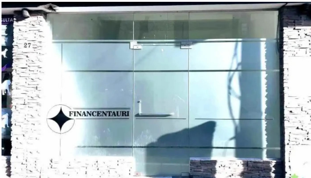
Finacentauri sas del propietario