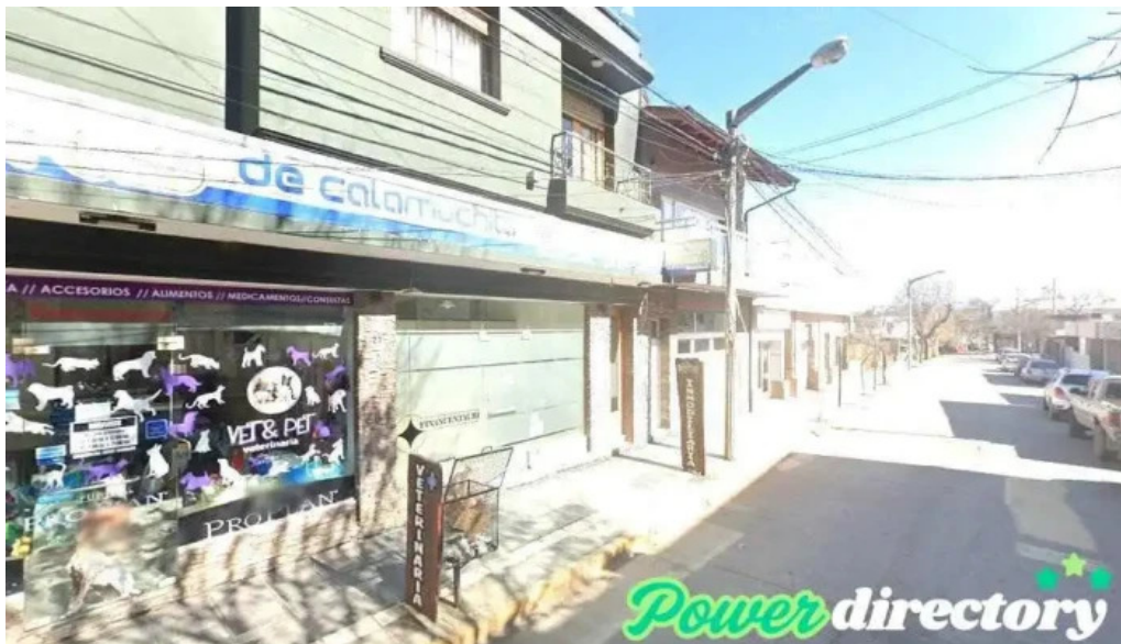
Finacentauri sas santa rosa de calamuchita