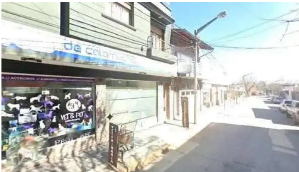
Finacentauri sas abierto ahora