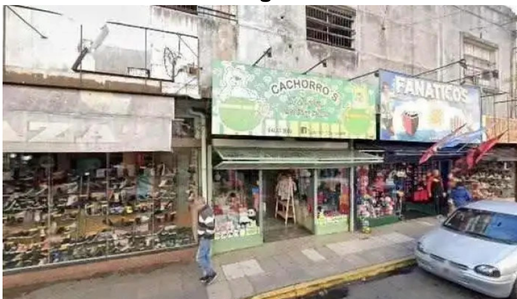
Soluciones economicas telefono