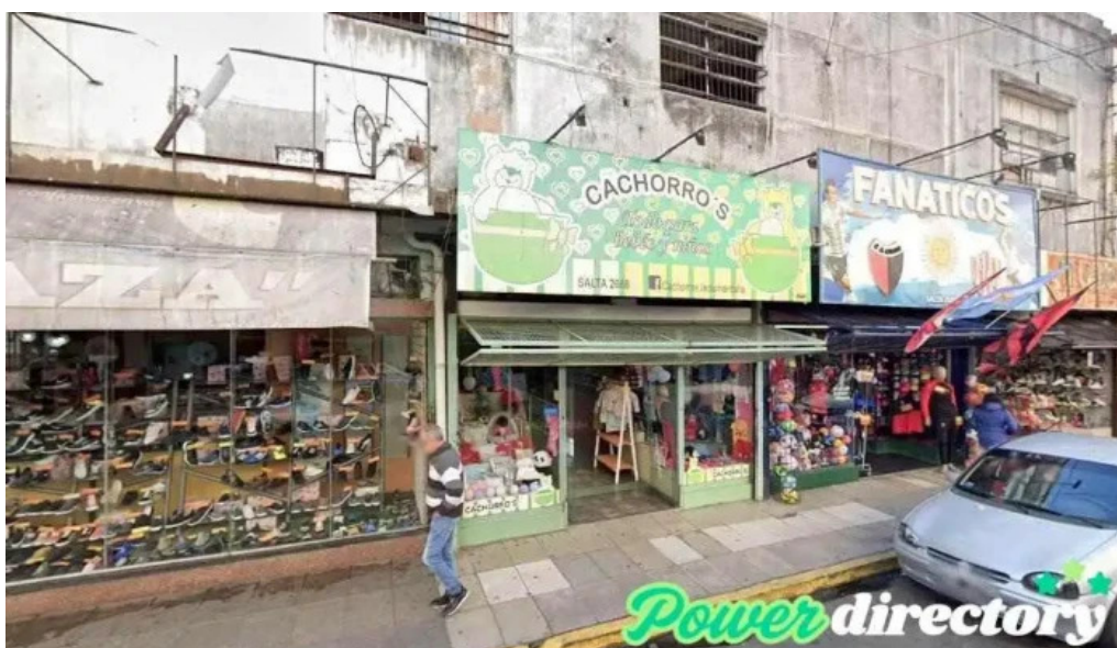
Soluciones economicas santa fe de la vera cruz