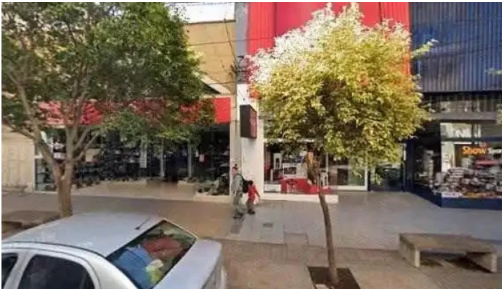
Prestamos con tarjeta de credito en el acto jujuy comentarios