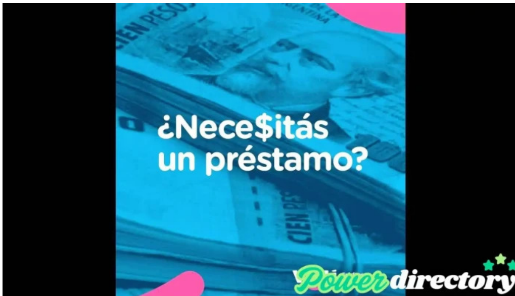
Viru credits del propietario