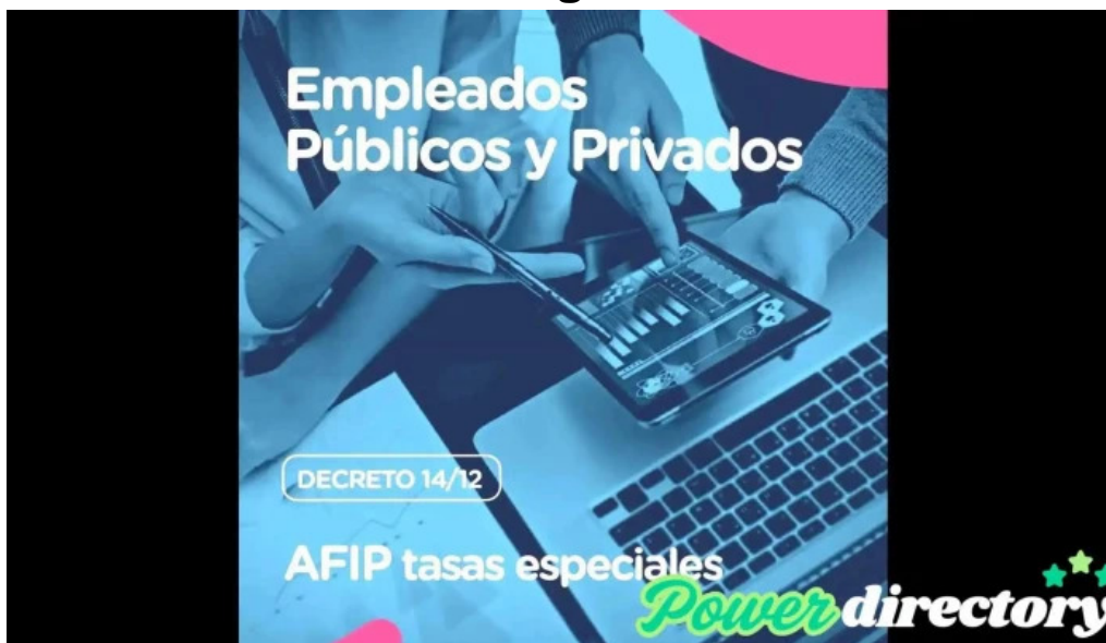
Viru credits videos