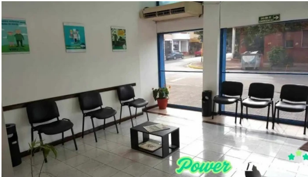
Viru credits interior