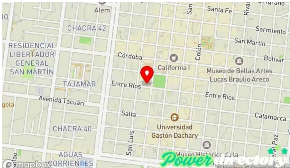
Viru credits mapa