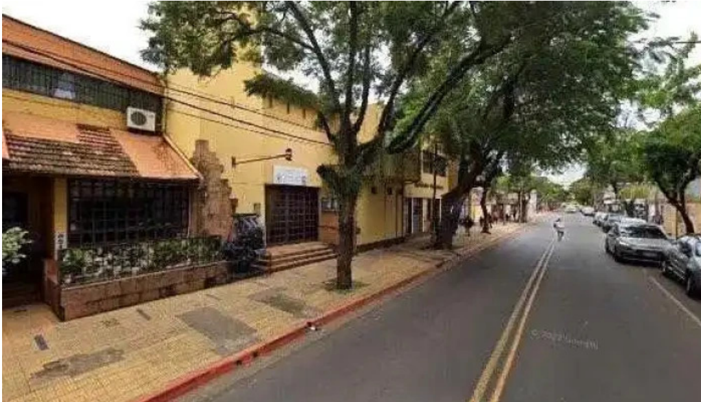
Viru credits opiniones