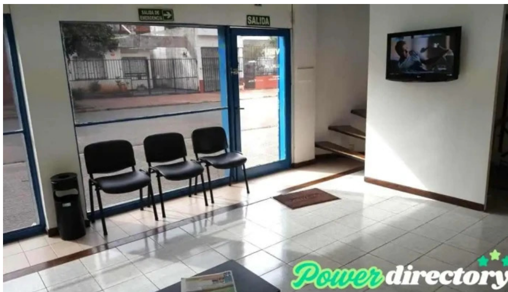
Viru credits posadas