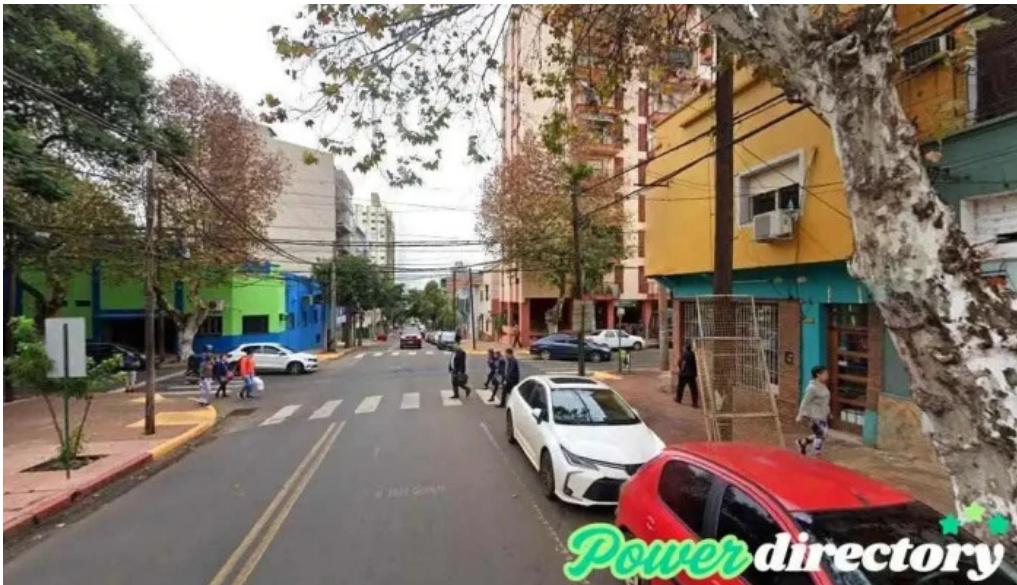
Acceda prestamos personales posadas