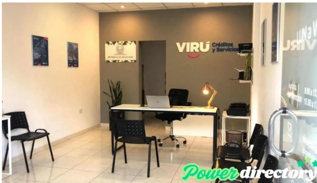
Viru credits obra obrera a m f a y s obrera