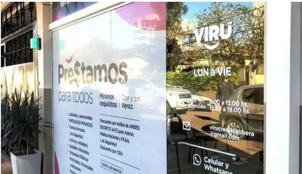
Viru credits obra amfays exterior