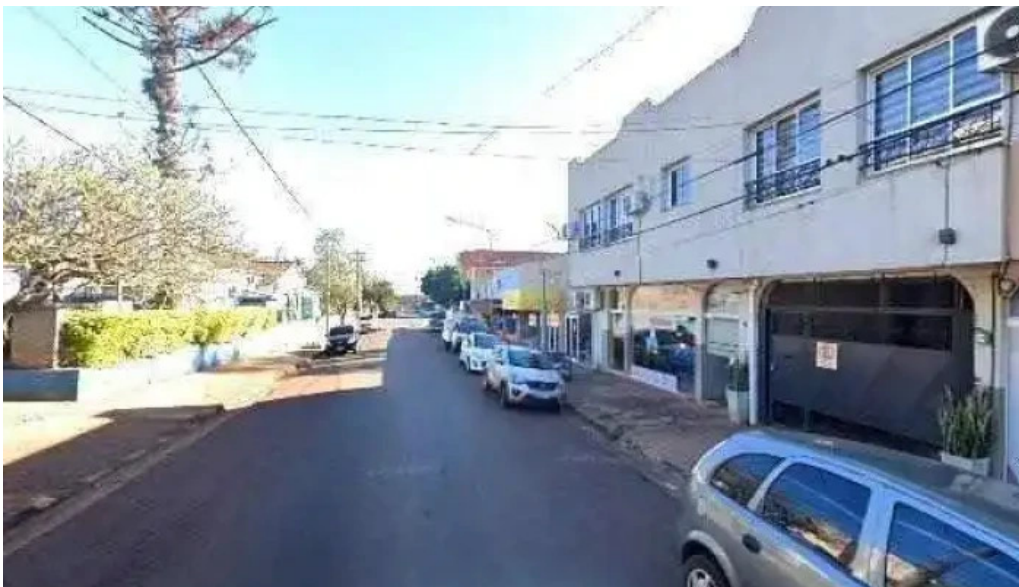
Viru creditos obero amfays zonadeg