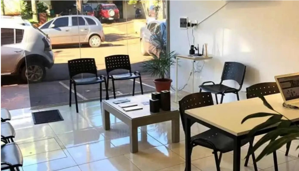
Viru credits obra amfays interior