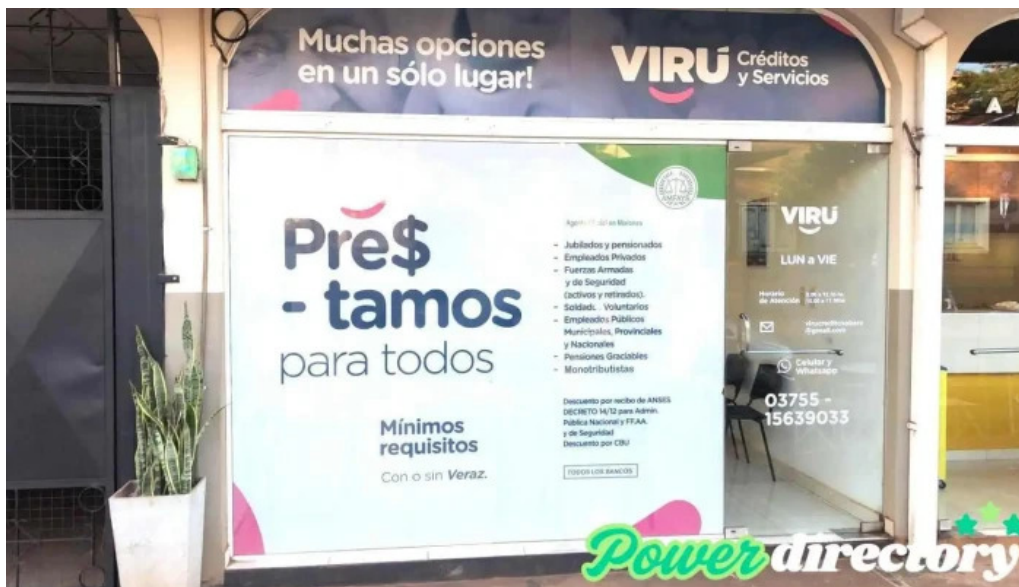
Viru credits obra obrera del propietario