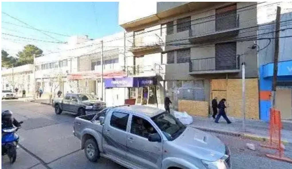
Vicente compania financiera dondedeg