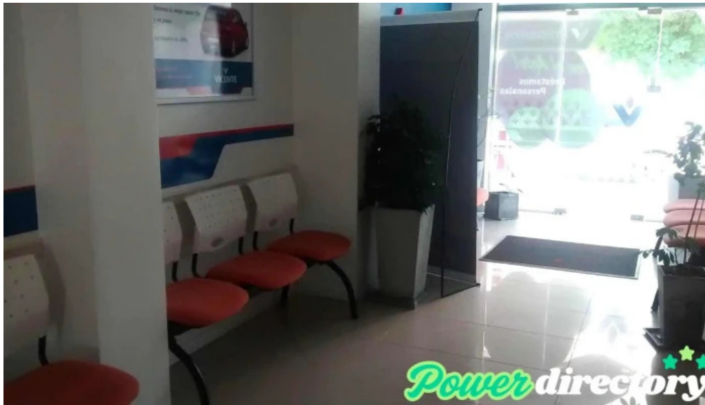
Vicente compania financiera donde