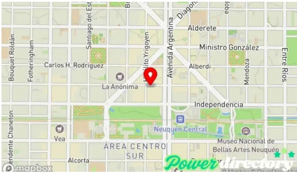
Vicente compania financiera mapa