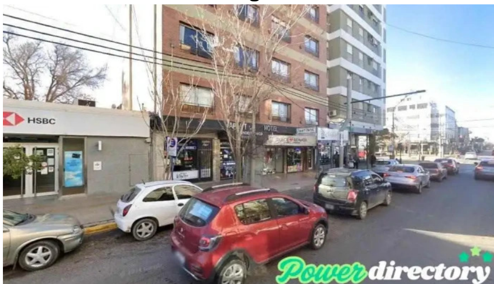
Presta cash neuquen