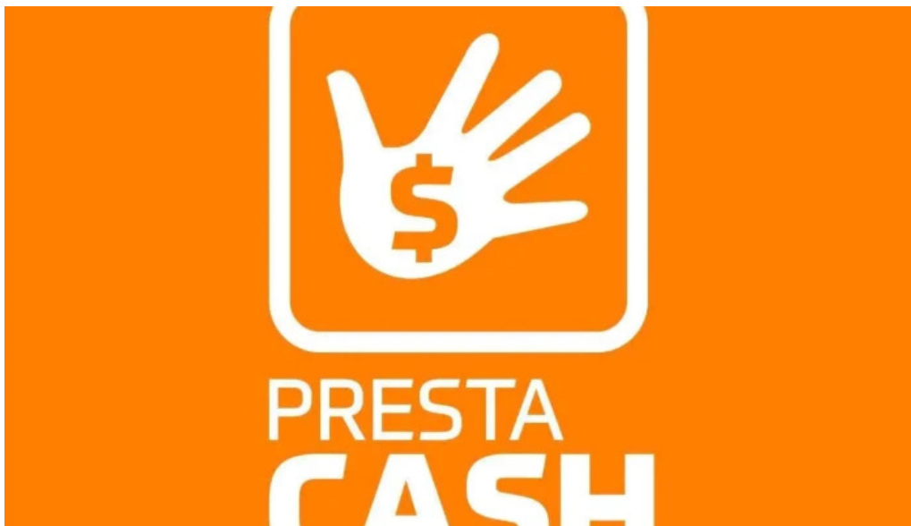
Presta cash del propietario