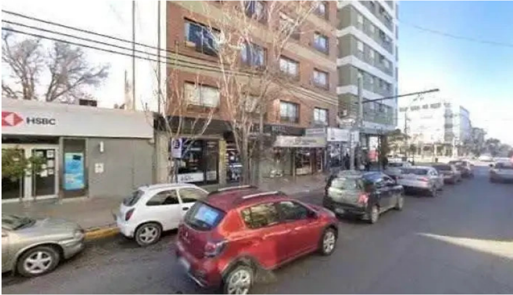
Presta cash descuentos