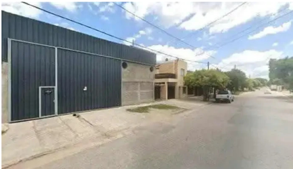
Mundo cred numero