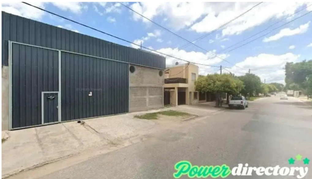
Mundo cred jesus maria