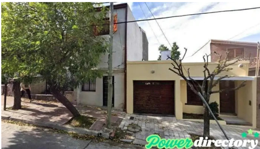
Negocio e inversion oro euros rentabilidad cordoba