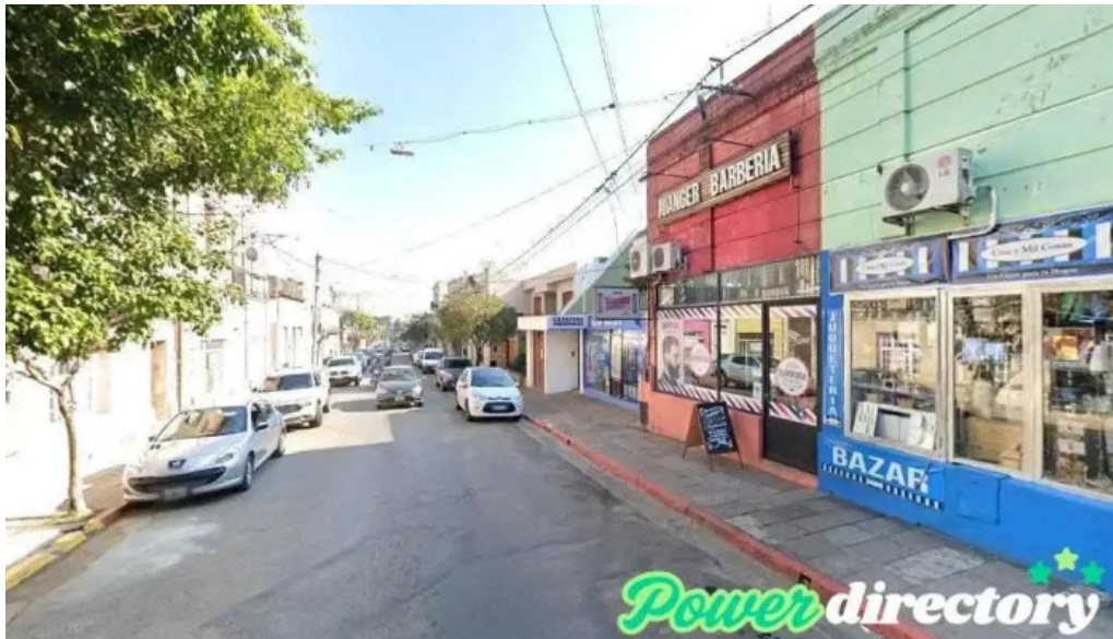
Grupo roble concordia