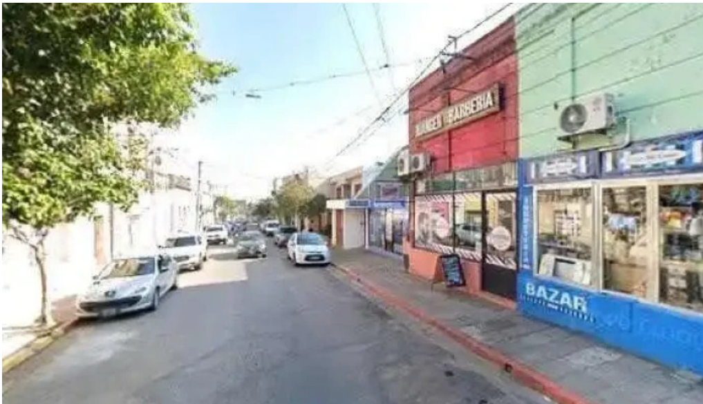
Grupo roble ubicacion