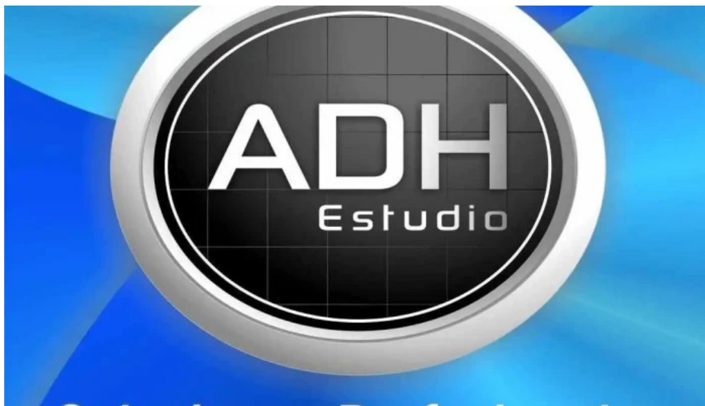
Grupo roble del propietario