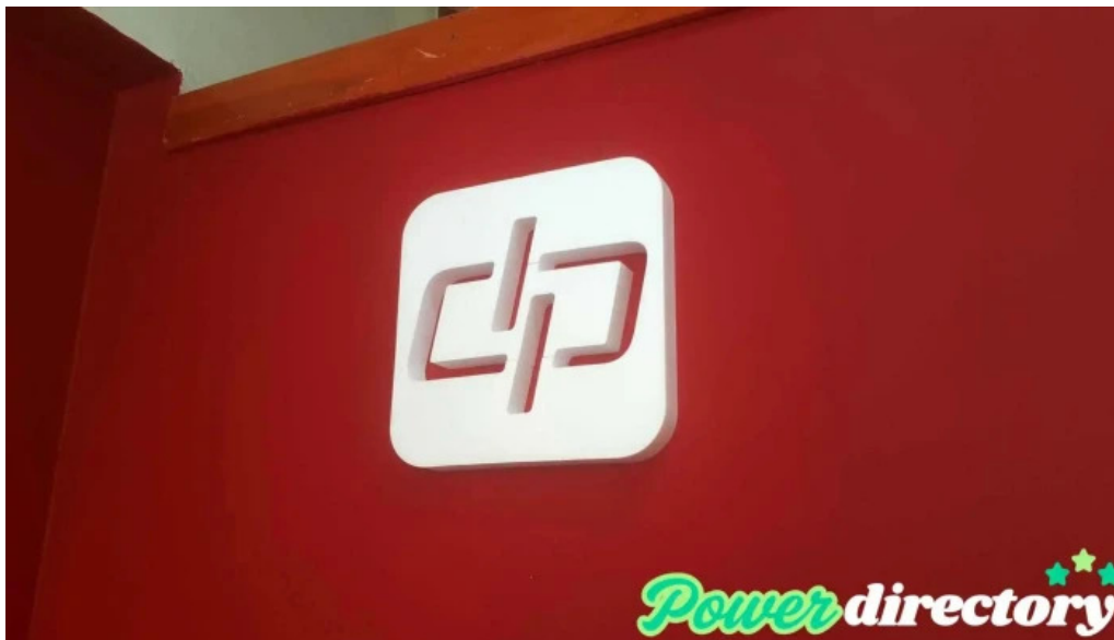
Credicip del propietario