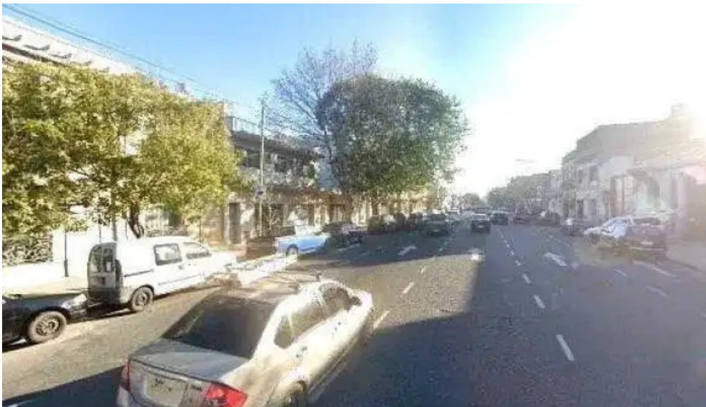
Vida activa mutual numero