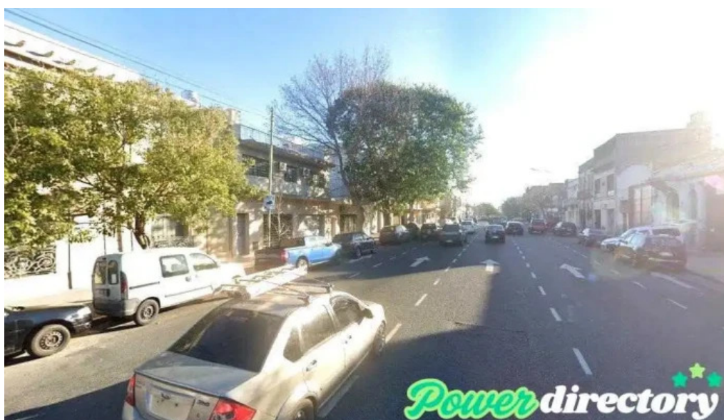
Vida activa mutual cdad autonoma de buenos aires