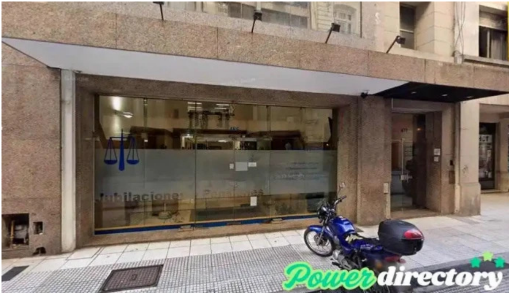
Prevercred s a cdad autonoma de buenos aires