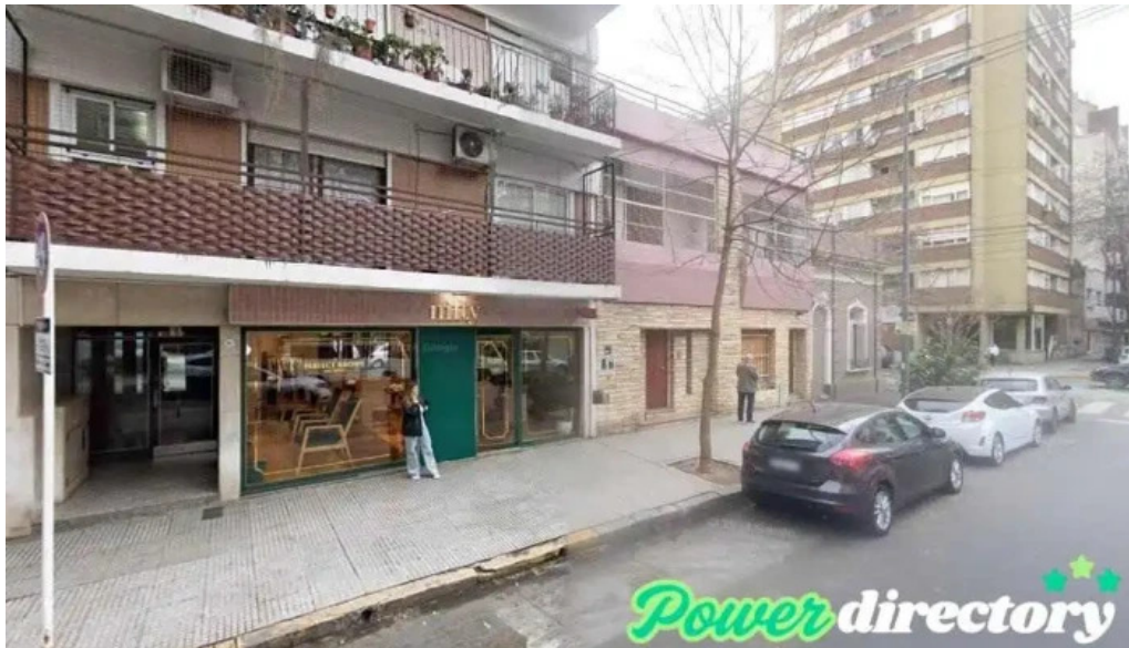
Efectivo financer belgrano cdad autonoma de buenos aires