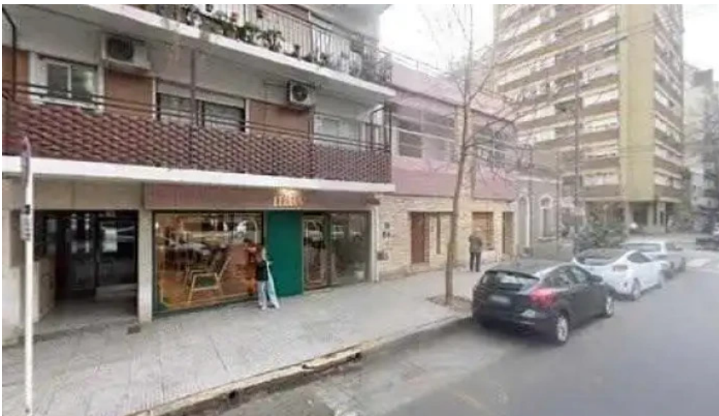
Efectivo financer belgrano videos