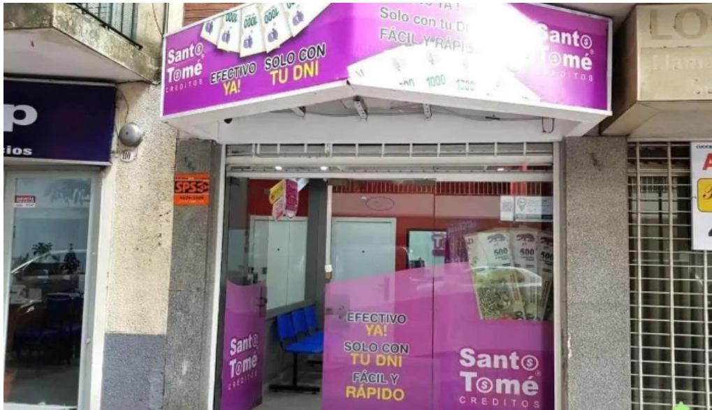
Creditos santo tome flores exterior