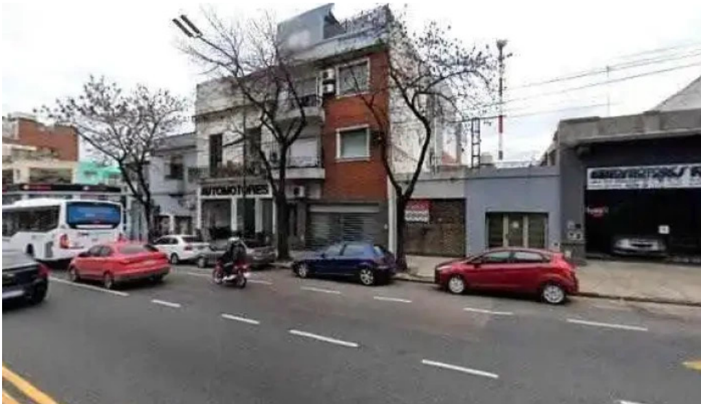
Creditos y financiacion automotor preciosdeg