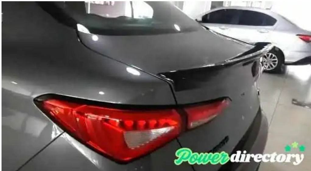
Creditos y financiacion automotor concesionario de automoviles