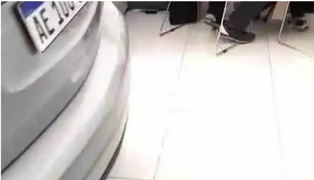
Creditos y financiacion automotor interior