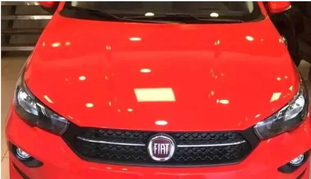
Creditos y financiacion automotor precios