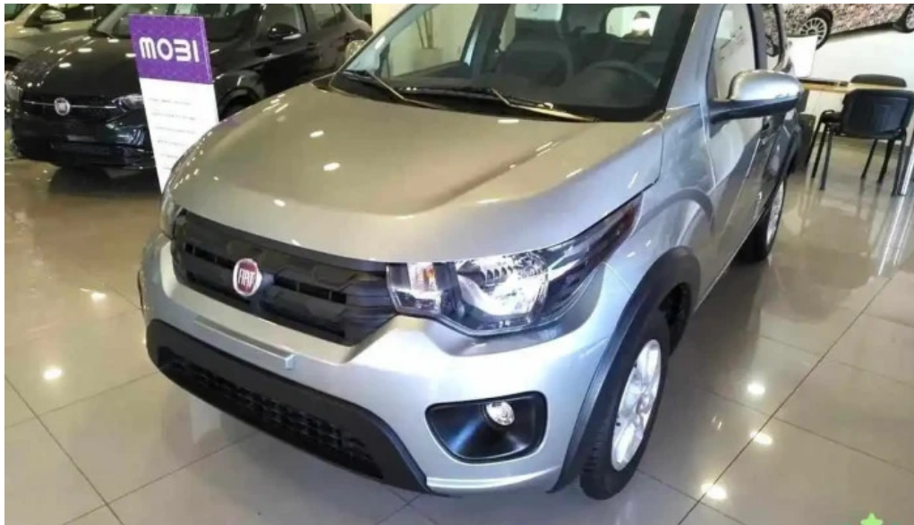
Creditos y financiacion automotor del propietario