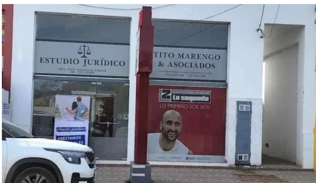
La segunda seguros villa del total catalogo