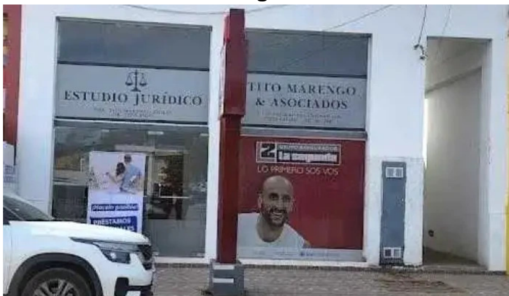
La segunda seguros villa del totoral villa del totoral