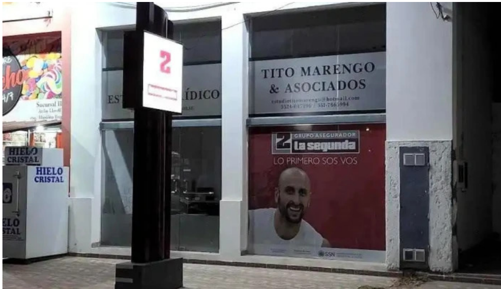
La segunda seguros villa del total exterior