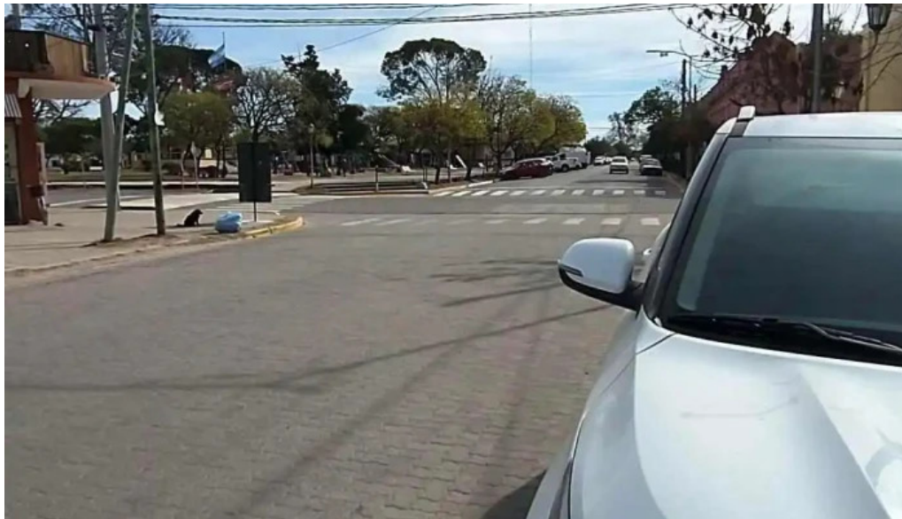
La segunda seguros villa del total del propietario