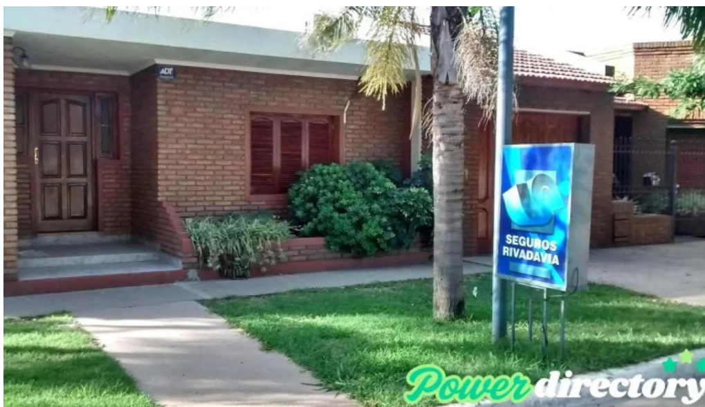
Seguros rivadavia arroyo seco