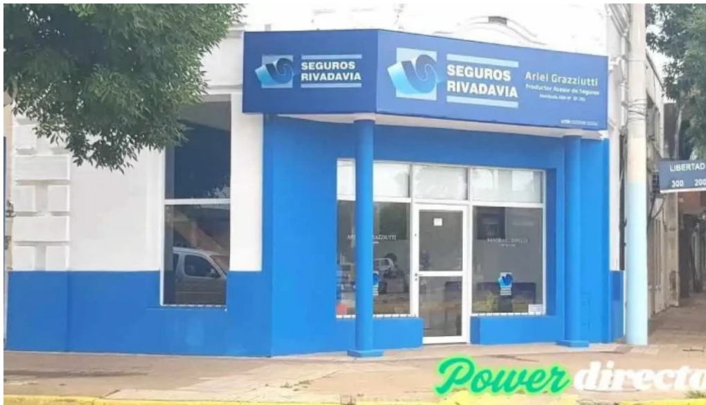
Seguros rivadavia exterior