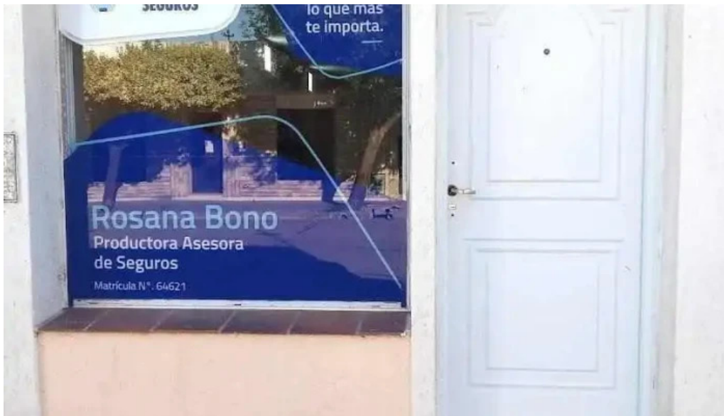
Cooperacion seguros arroyo cabral