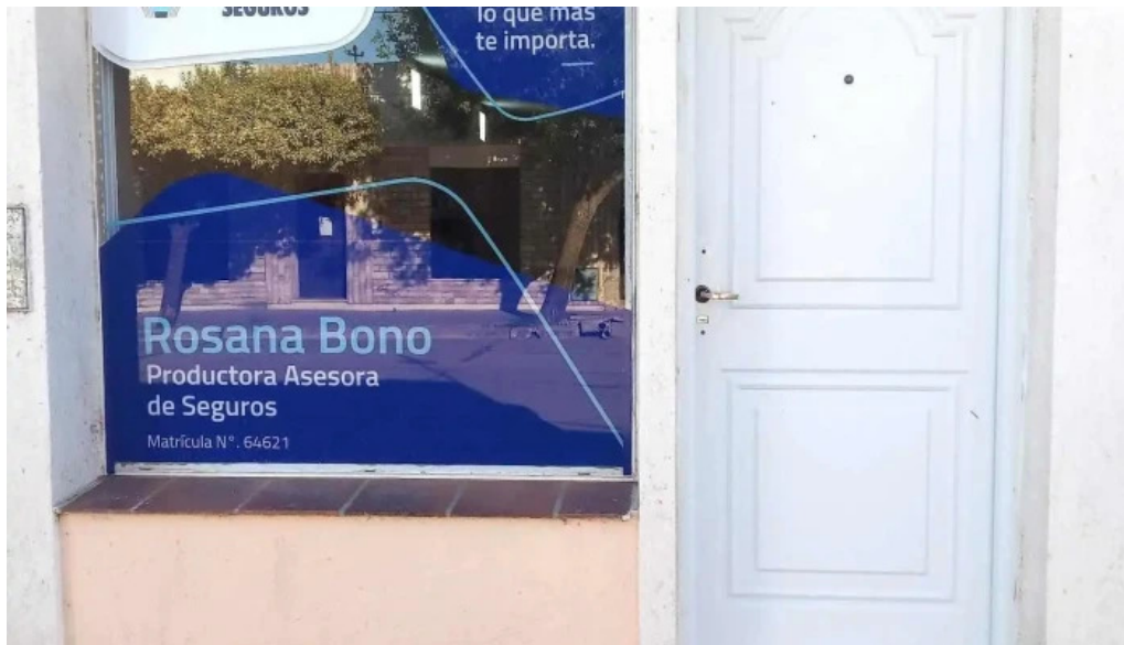
Cooperacion seguros videos