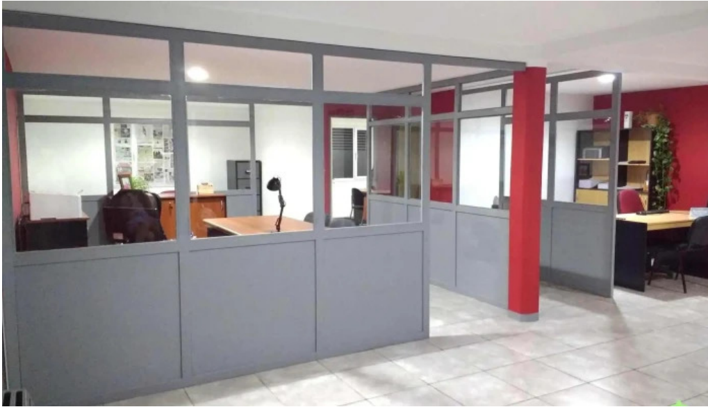
La segunda seguros y gestoria del automotor de rojas m graciela interior