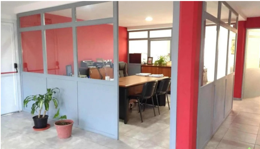
La segunda seguros y gestoria del automotor de rojas m graciela del propietario