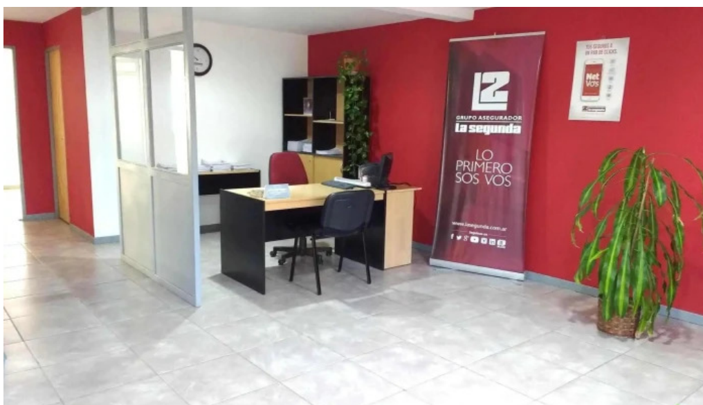
La segunda seguros y gestoria del automotor de rojas m graciela como llegar