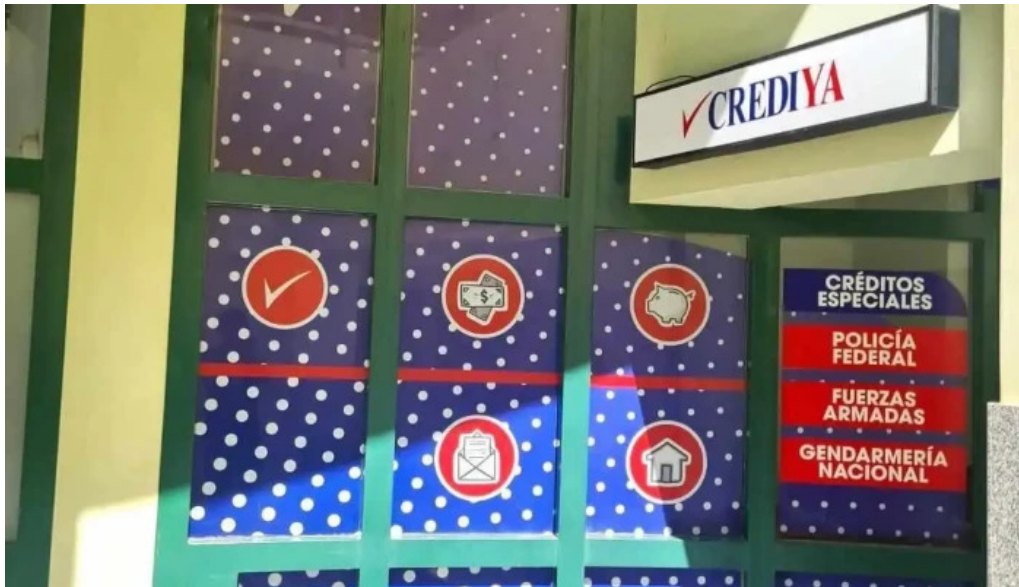
Crediya prestamos personales ubicacion