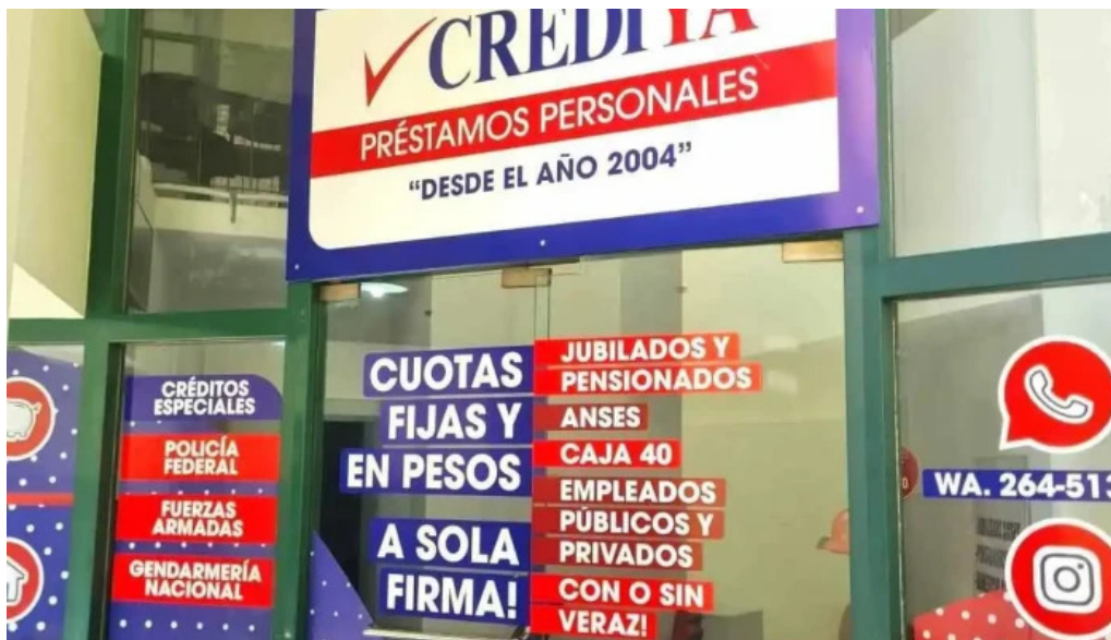
Crediya prestamos personales interior