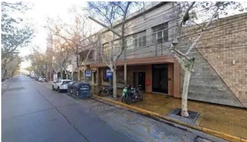
Crediya prestamos personales ubicaciondeg