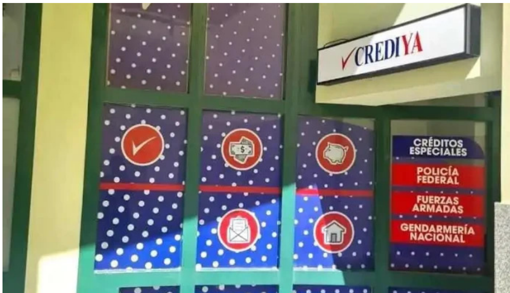
Crediya prestamos personales j5402guh