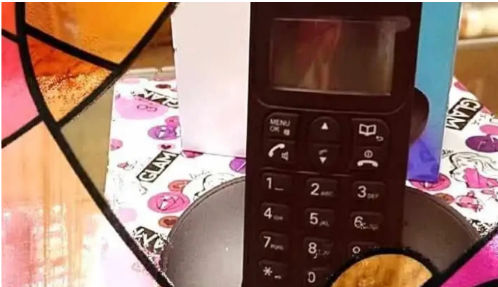
Cooperativa de credits y consumos 11 de agosto ltda del propietario