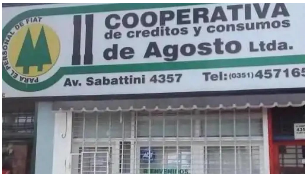
Cooperativa de creditos y consumos 11 de agosto ltda cordoba