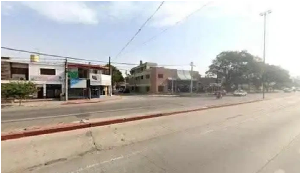
Cooperativa de credits y consumos 11 de agosto ltda instagram