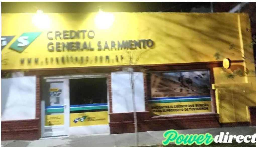
Credito general sarmiento chos malal