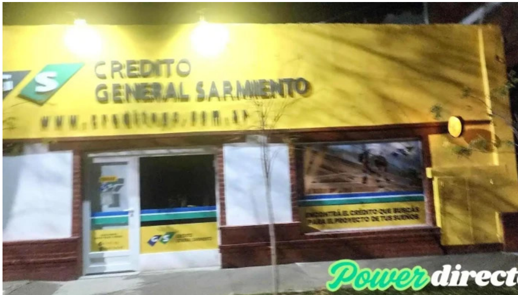
Credito general sarmiento abierto ahora