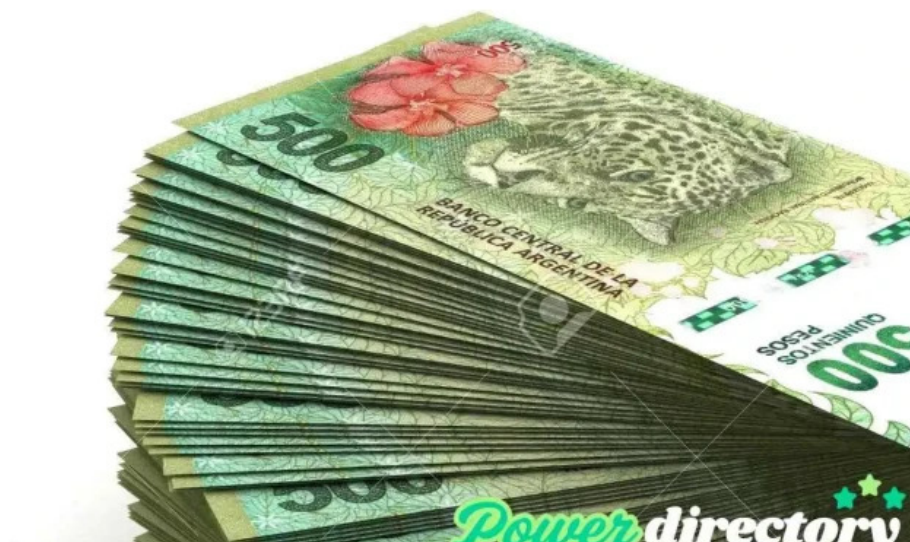
Efectivo con tarjeta cdad autonoma de buenos aires