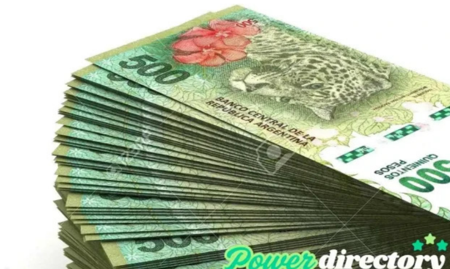
Efectivo con tarjeta donde