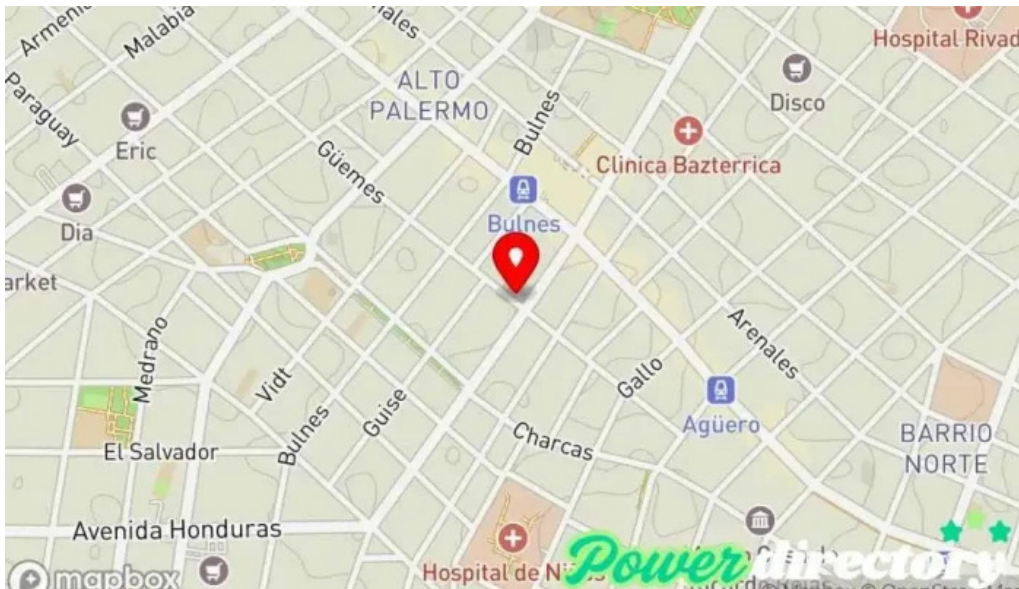
Efectivo con tarjeta mapa