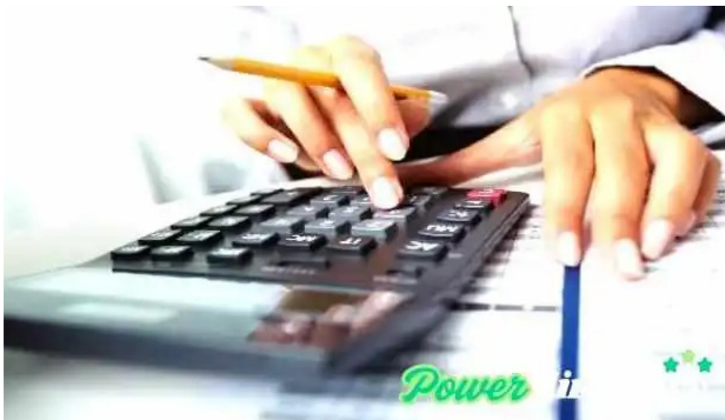
Efectivo con tarjeta del propietario