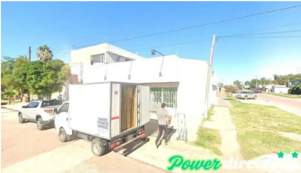
Multicash buena esperanza