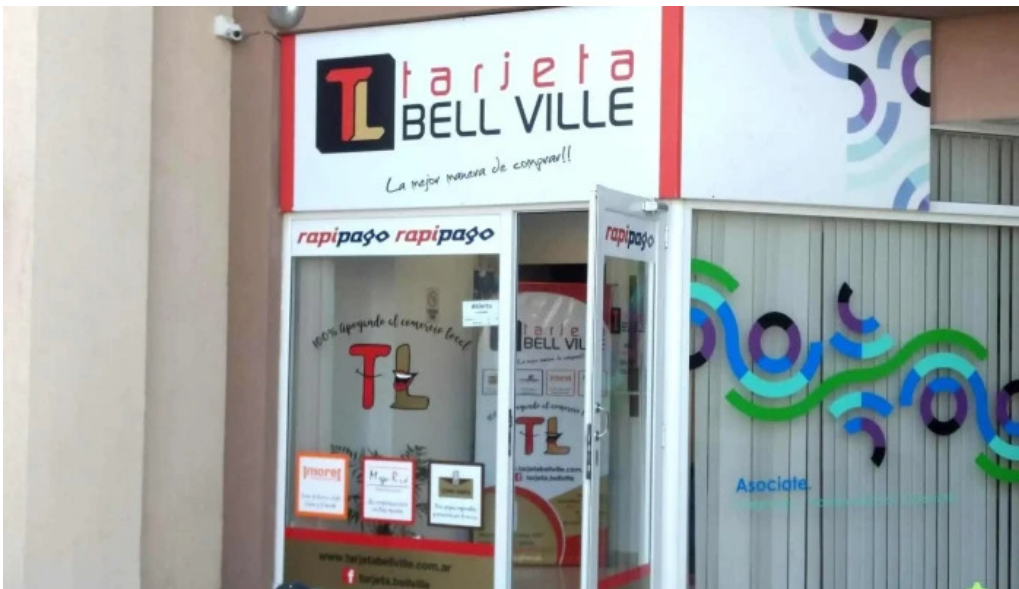
Tarjeta bell ville comentarios