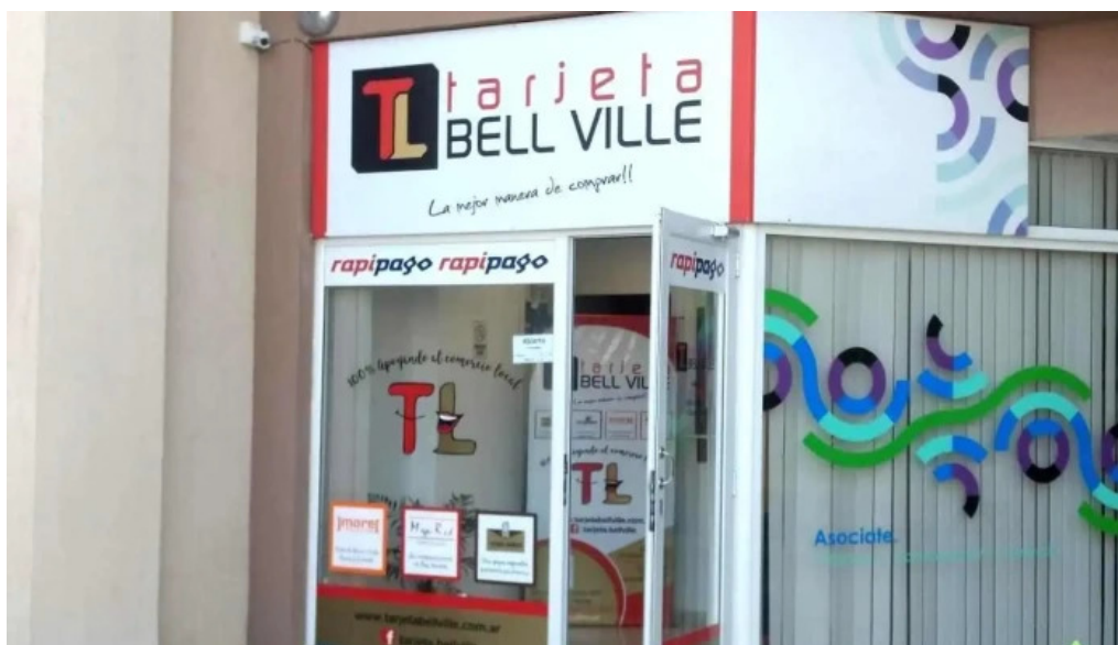
Tarjeta bell ville bell ville