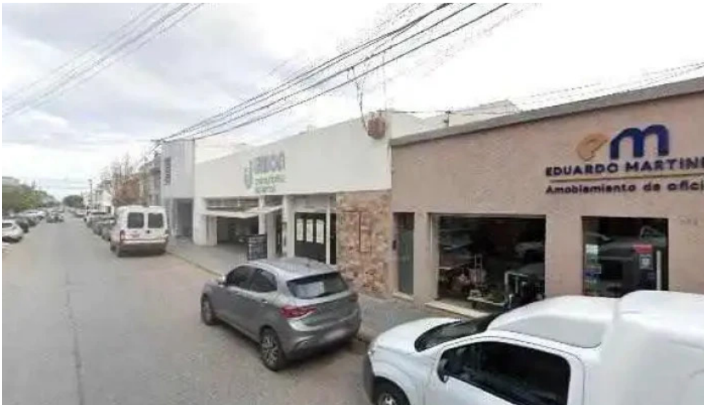
Tarjeta bell ville comentariosdeg