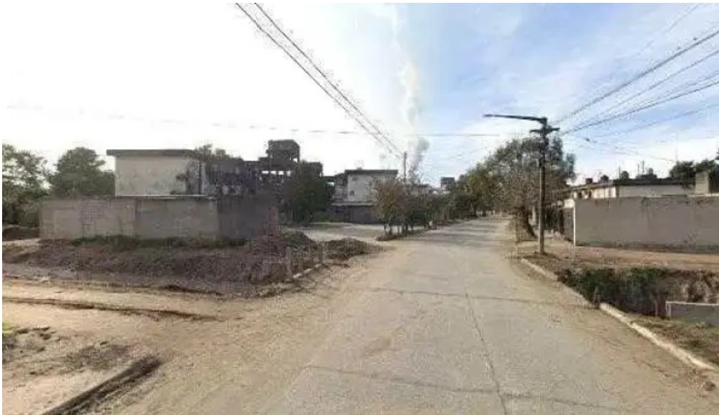
Lara monteros comentarios