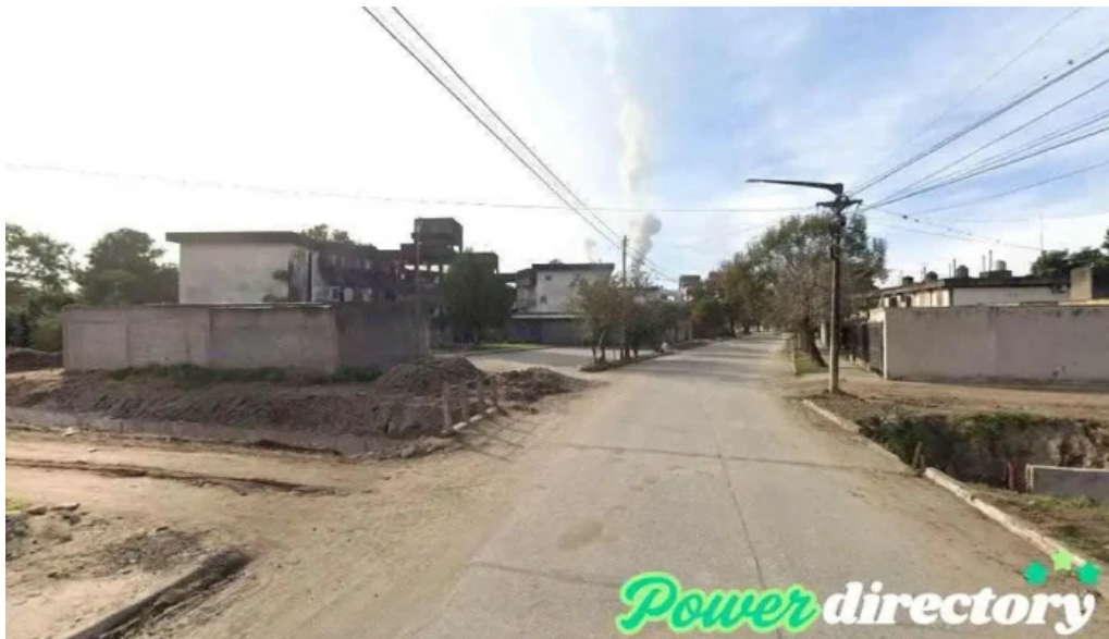
Lara monteros monteros