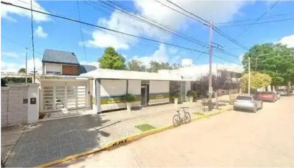
Cajero automatico banco macro videos