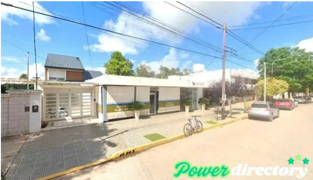
Cajero automatico banco macro monte maiz