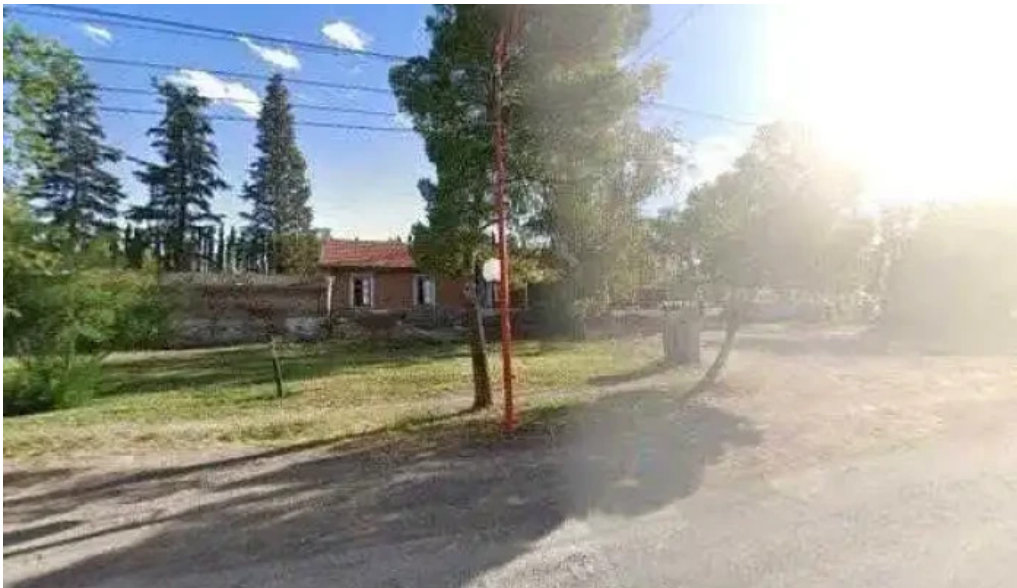
Banco patagonia centro de atencion comercial chichinales puntaje