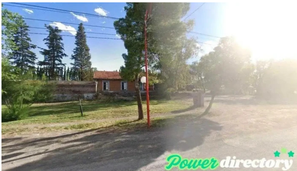
Banco patagonia centro de atencion comercial chichinales chichinales