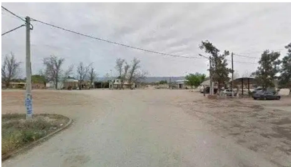
Cajero banco rioja abierto ahoradeg