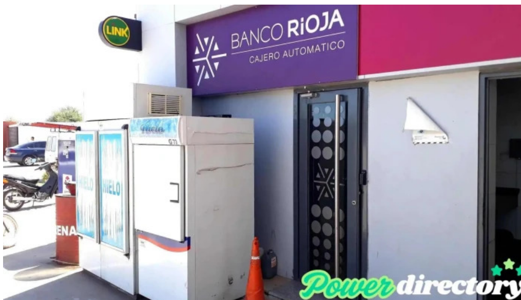
Cajero banco rioja chamental