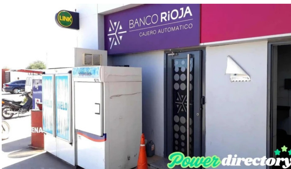
Cajero banco rioja abierto ahora