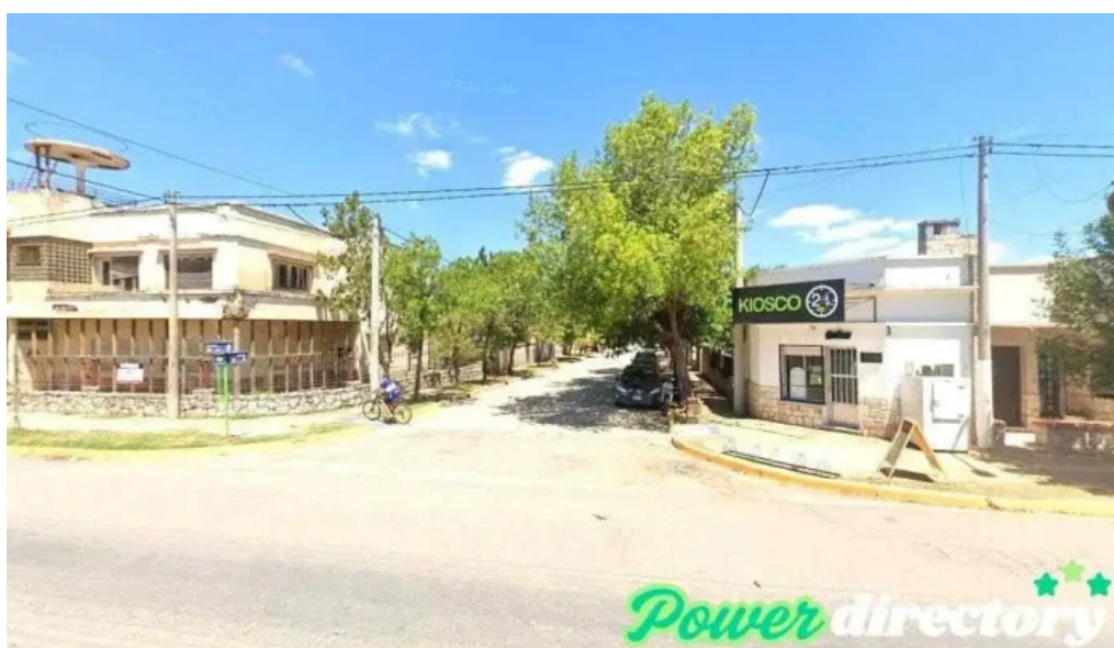
Bancor la francia