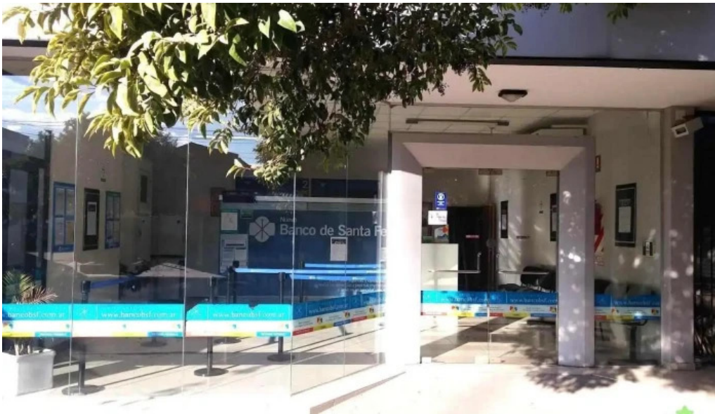
Banco de santa fe malabrigo