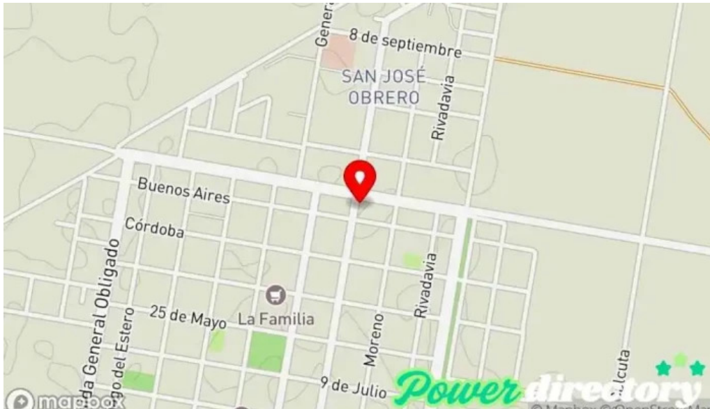
Banco de santa fe mapa