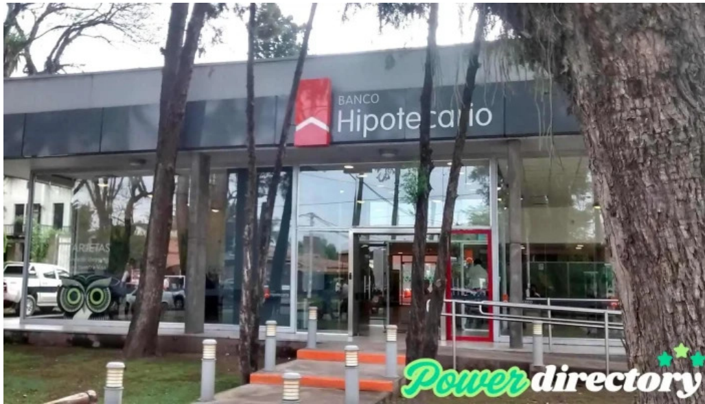
Banco hipotecario exterior