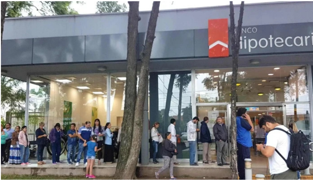
Banco hipotecario yerba buena