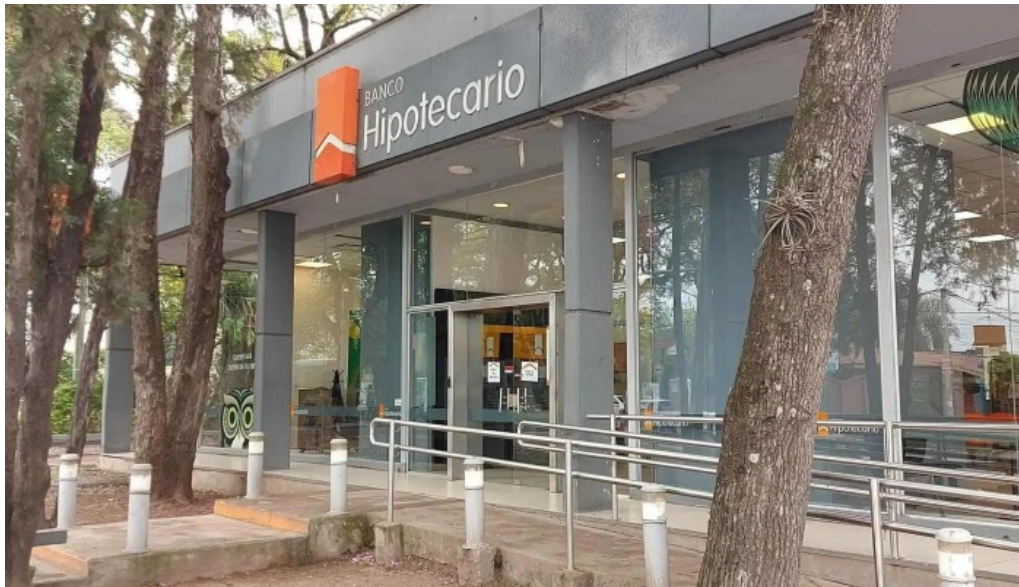
Banco hipotecario donde