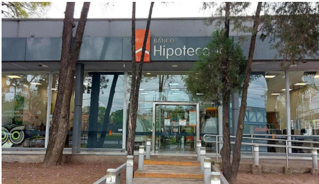
Banco hipotecario abierto ahora