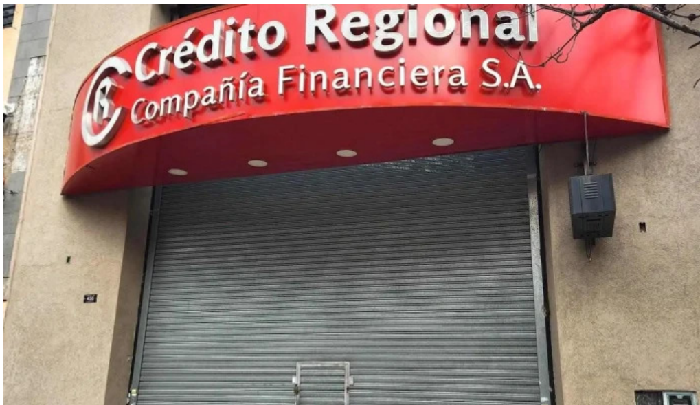
Credito regional compania financiera sa exterior