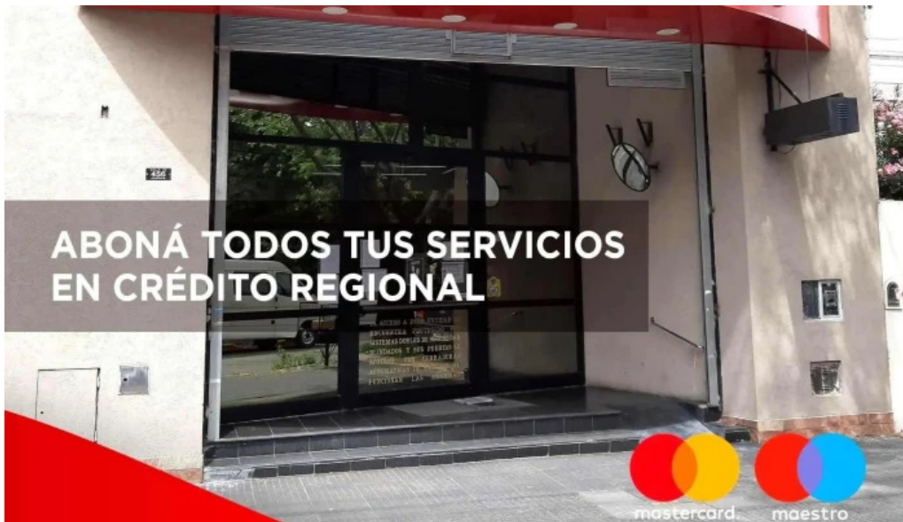
Credito regional compania financiera sa instagram