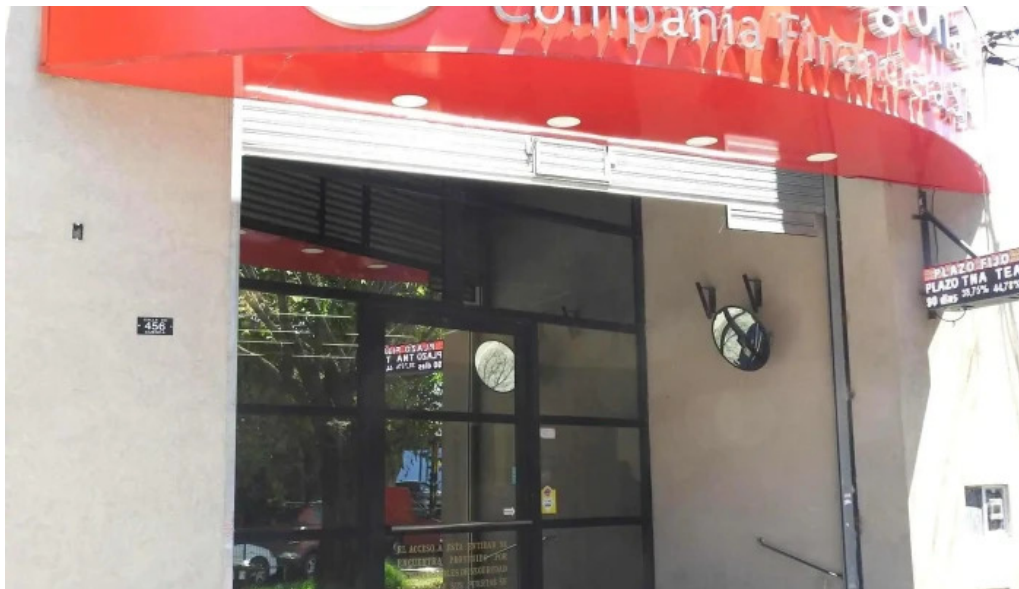
Credito regional compania financiera sa del propietario