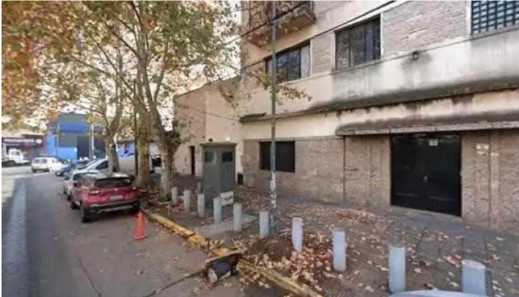
Credito regional compania financiera sa instagramdeg