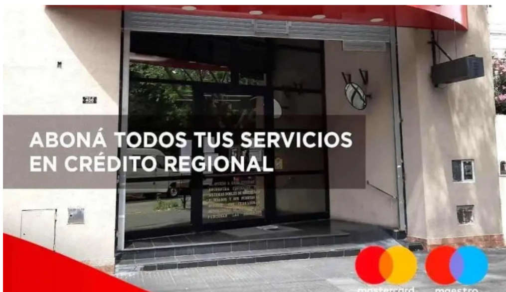
Credito regional compania financiera s a villa lynch