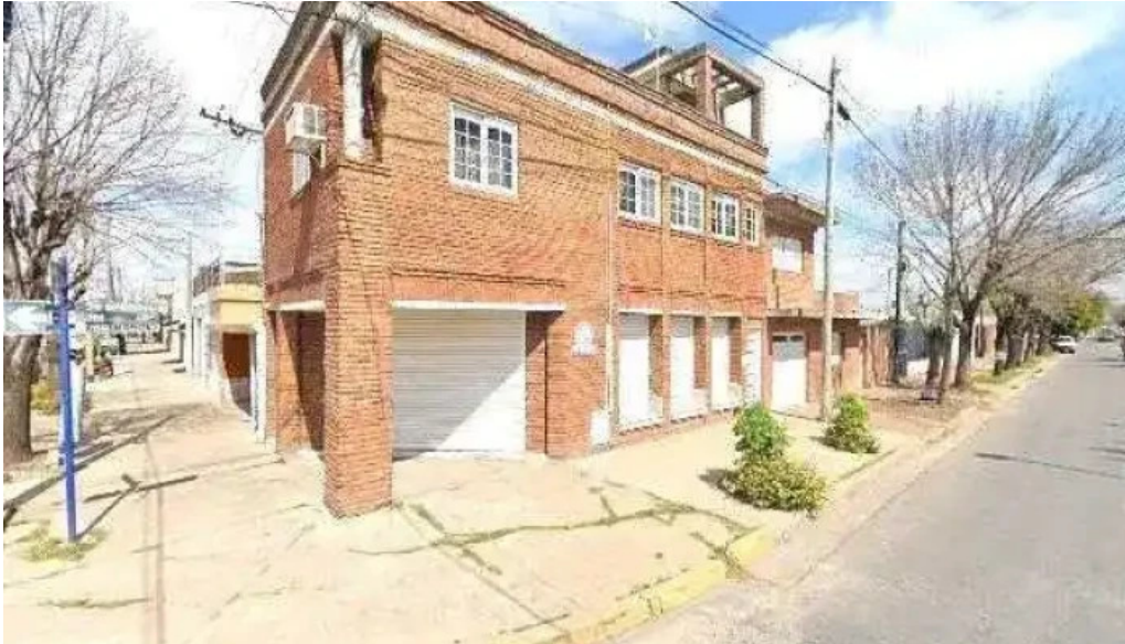
Mutual de los arroyos telefono