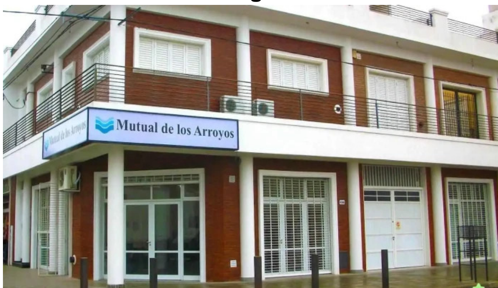
Mutual de los arroyos villa constitucion