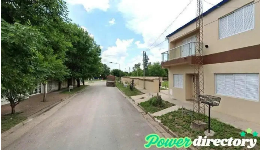
Banco entre rios villa aranguren