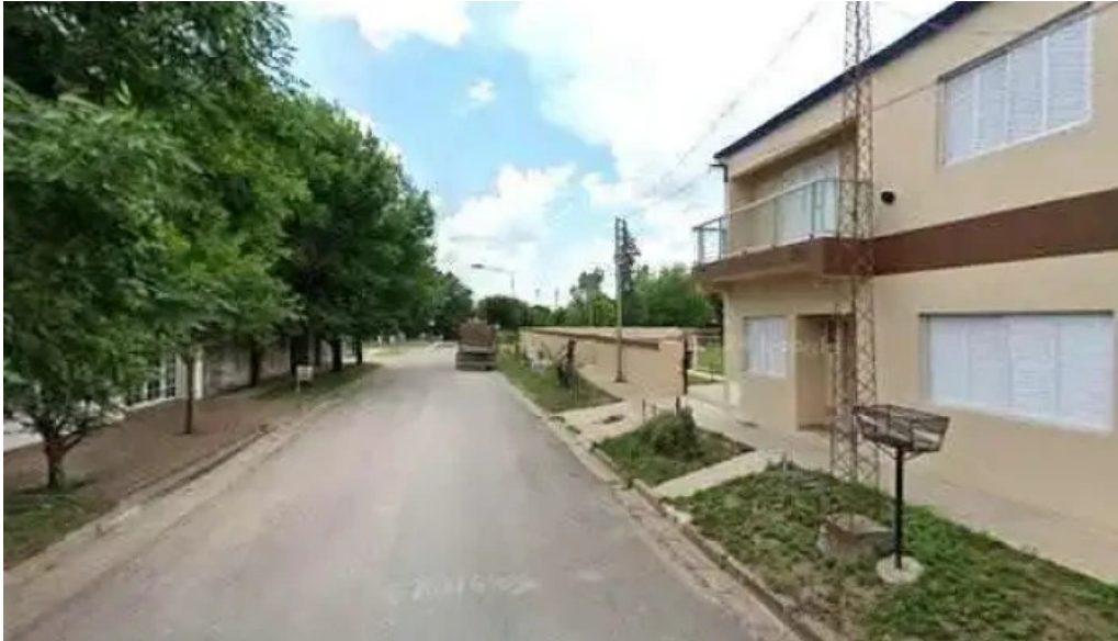
Banco entre rios fotos