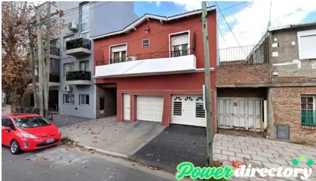
Creditos hoy sarand