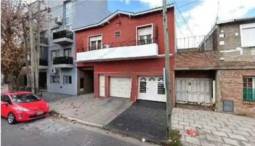
Creditos hoy donde