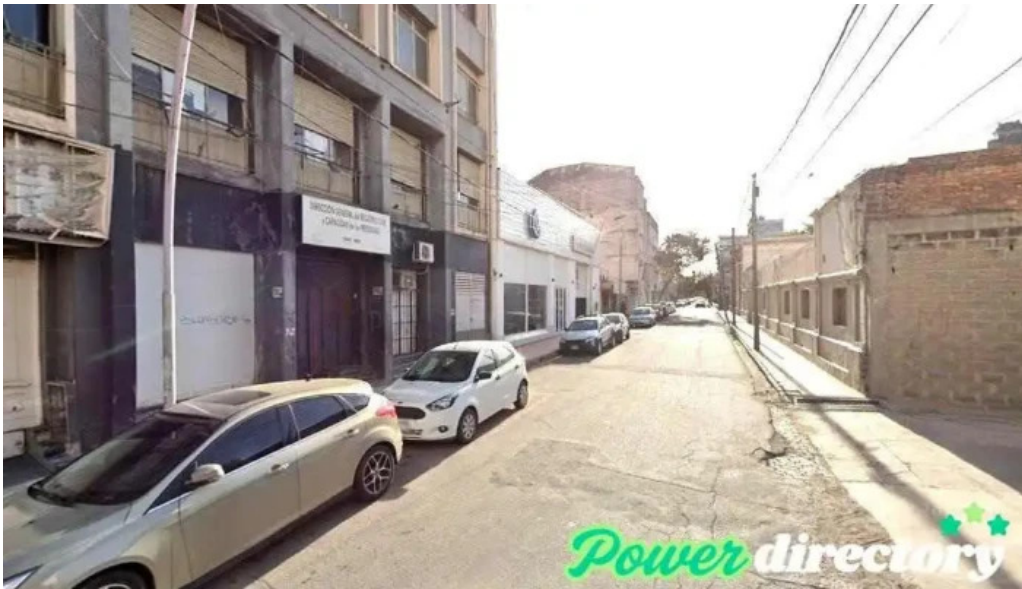
Sarmiento creditos santiago del estero