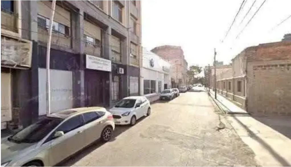
Sarmiento creditos videos