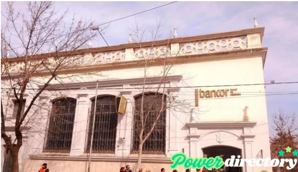
Banco de cordoba telefono