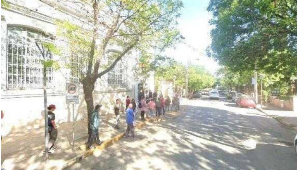
Banco de cordoba telefonodeg