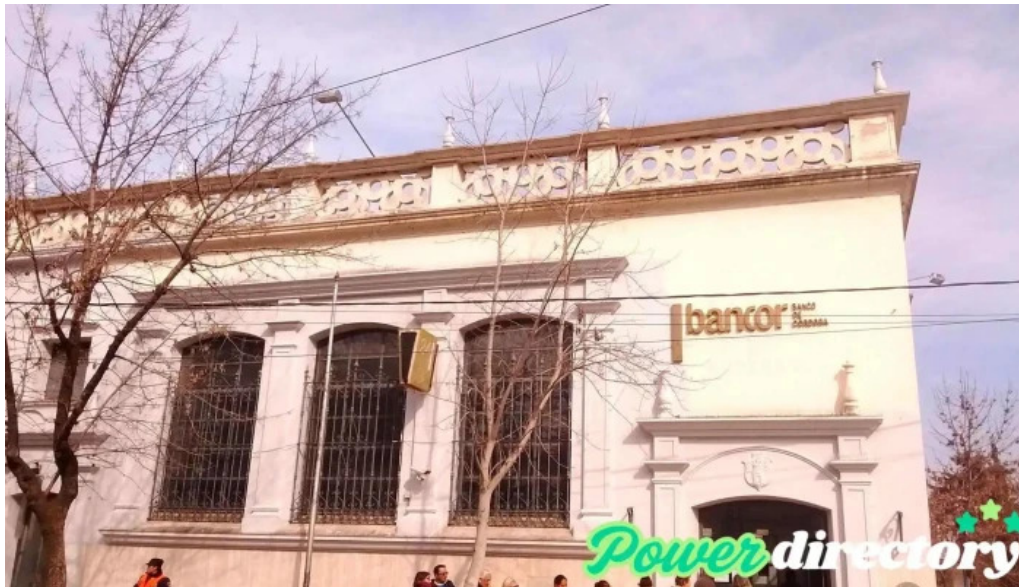
Banco de cordoba santa rosa de calamuchita