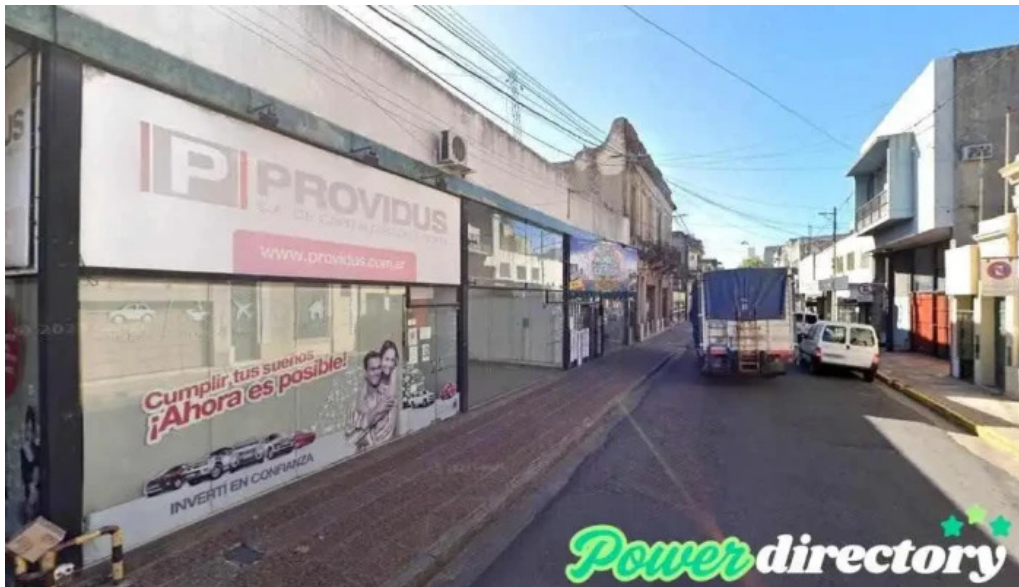
Providus santa fe de la vera cruz